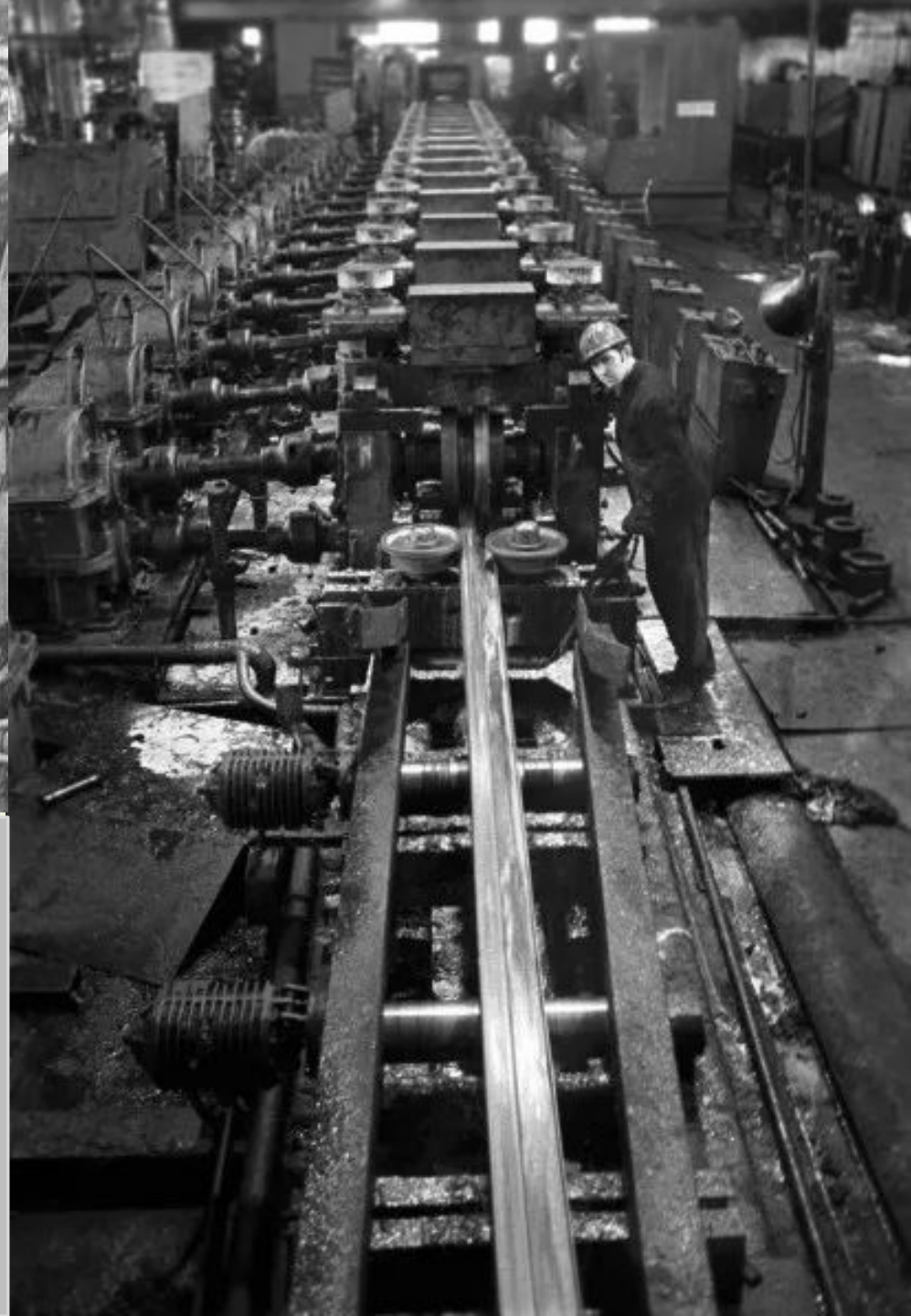
Завод «Запорожсталь» имени Серго Орджоникидзе