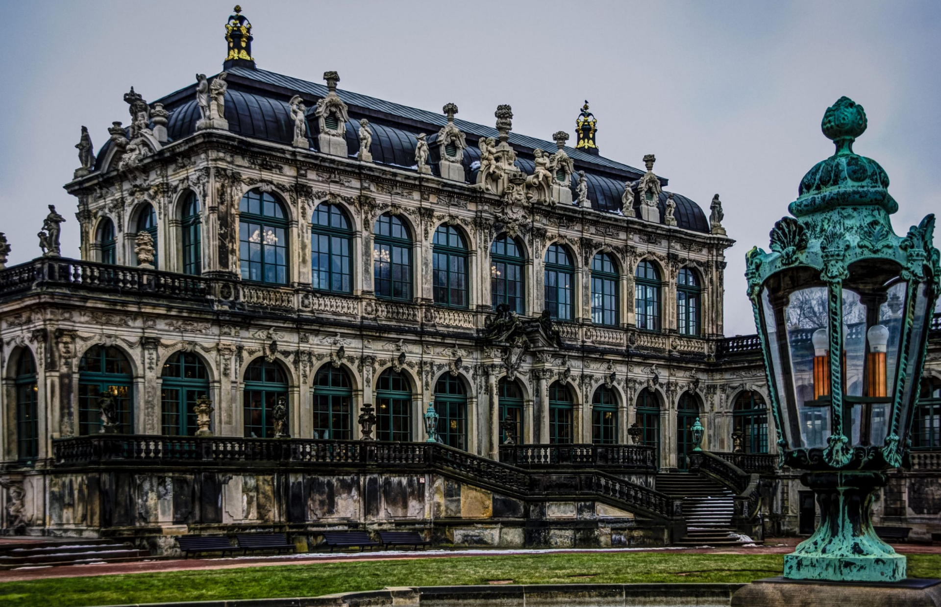
Цвингер (Дрезден). М. Пёппельман, Г. Земпер