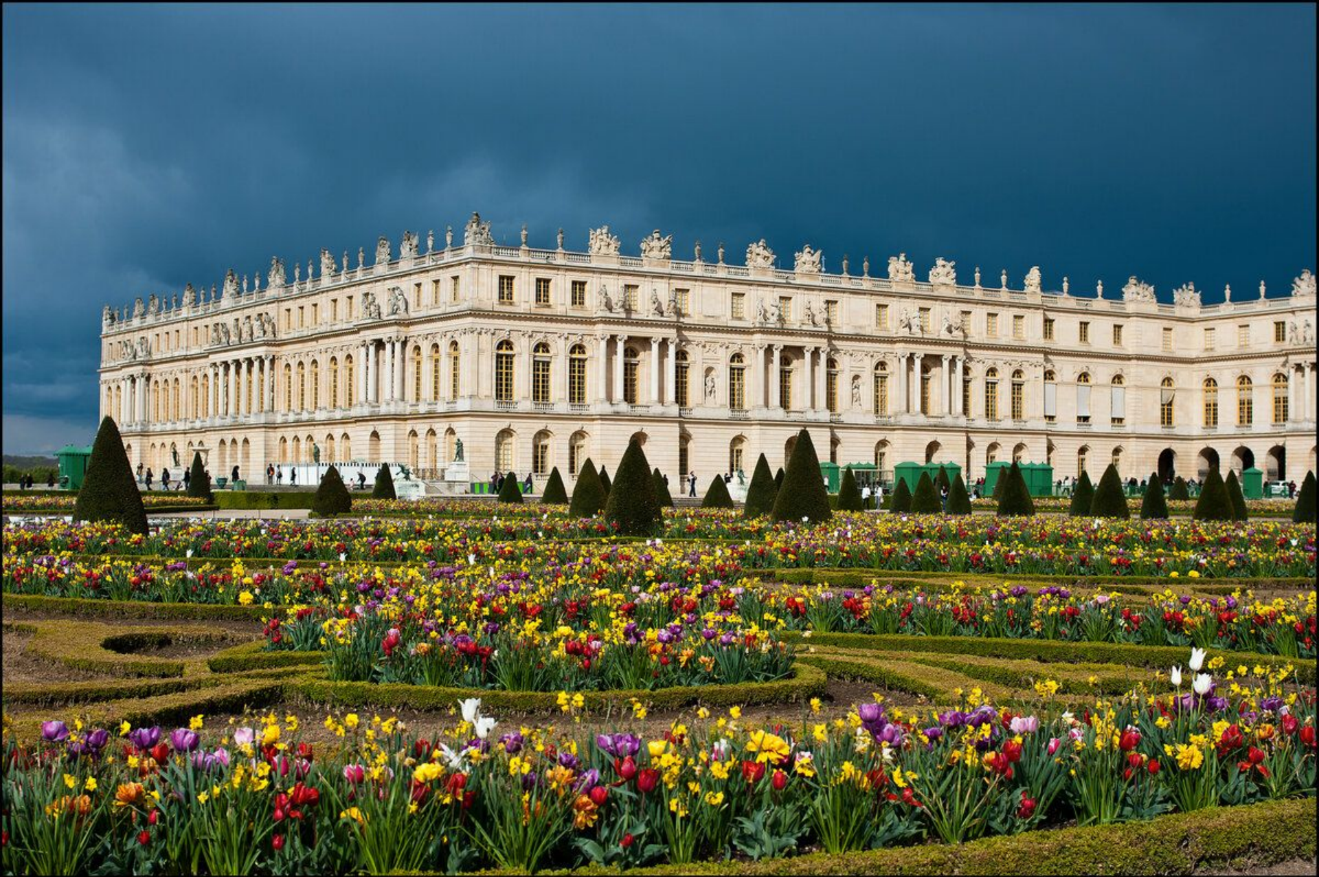
Версальский дворец (Париж). Луи Лево, Жюль Арруэн-Мансар