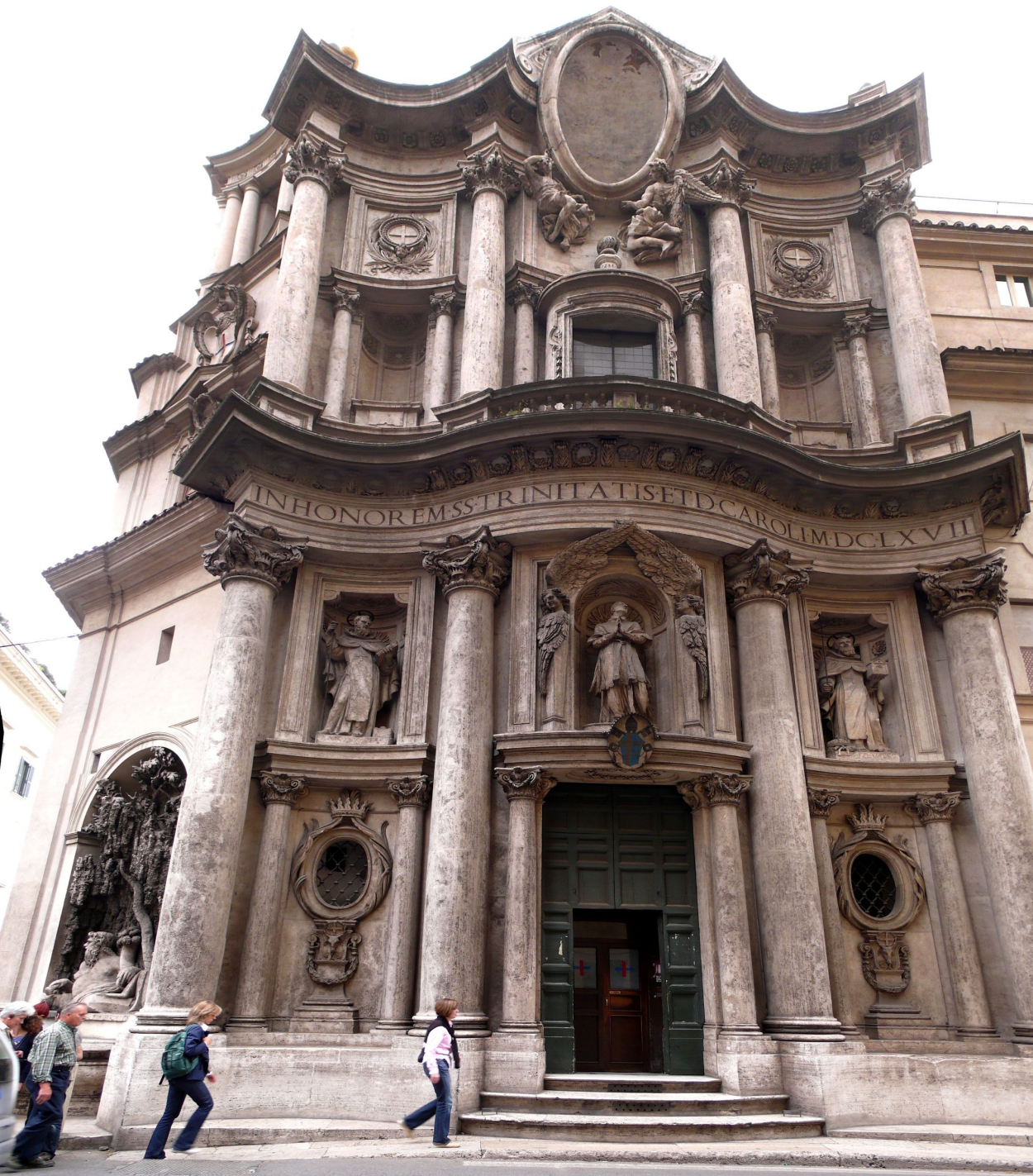
Церковь Сан Карло алле Куатро Фонтане (Рим). Фр. Бернини