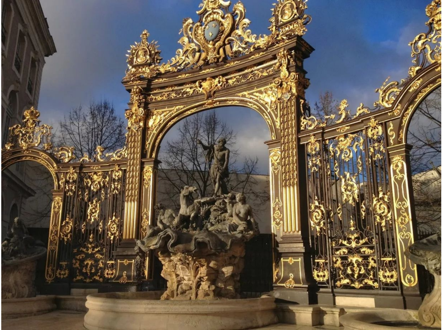
Фонтан и решетки на Королевской площади (Нанси, Франция). Ж. Ламур