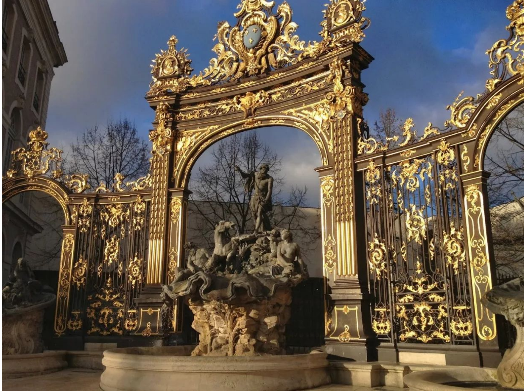
Фонтан и решетки на Королевской площади (Нанси, Франция). Ж. Ламур