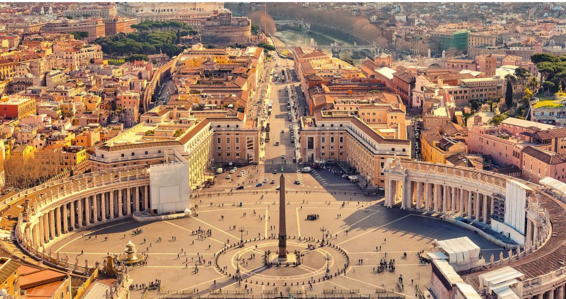
Площадь перед Собором Святого Петра (Рим). Дж.Бернини