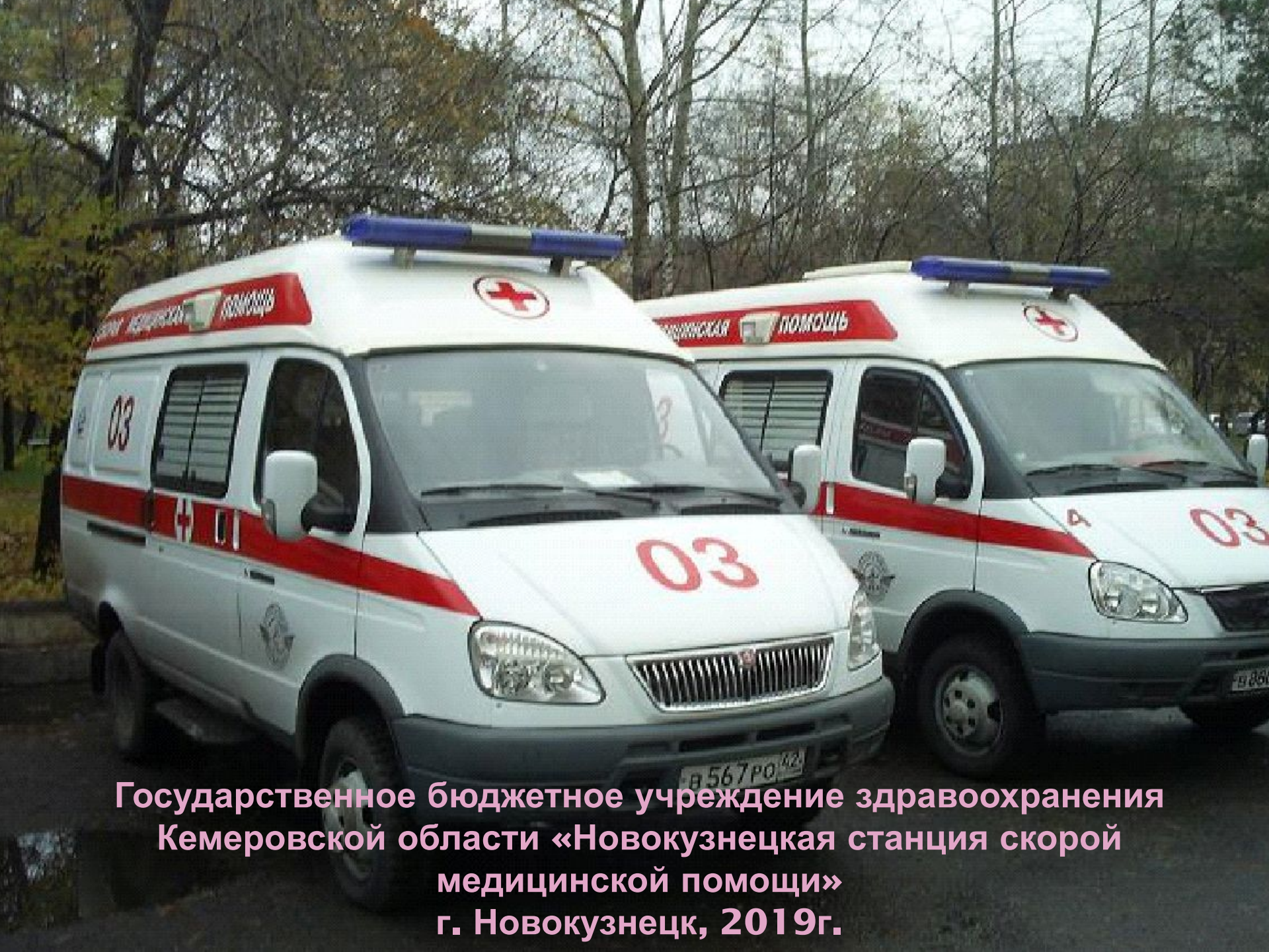
Государственное бюджетное учреждение здравоохранения Кемеровской области «Новокузнецкая станция скорой медицинской помощи» г. Новокузнецк, 2019г.