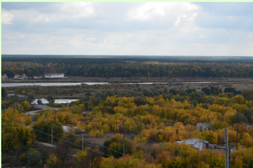
Русло реки Воронеж со старицами вблизи Рамони

Есть ли в окрестностях вашего населённого пункта (школы) озёра или болота?