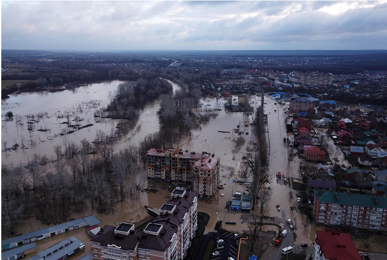
Наводнение в Краснодарском крае.2020г.