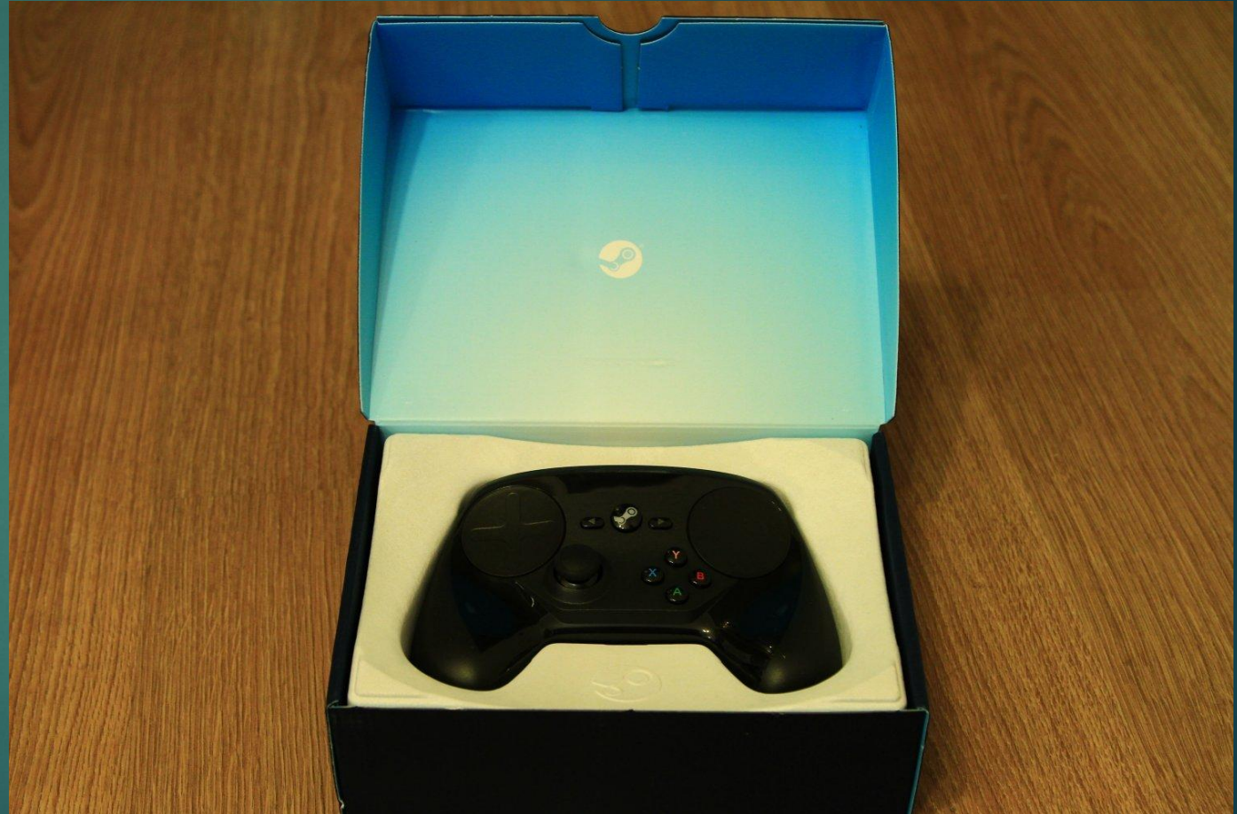
Steam Controller – геймпад для работы на компьютере