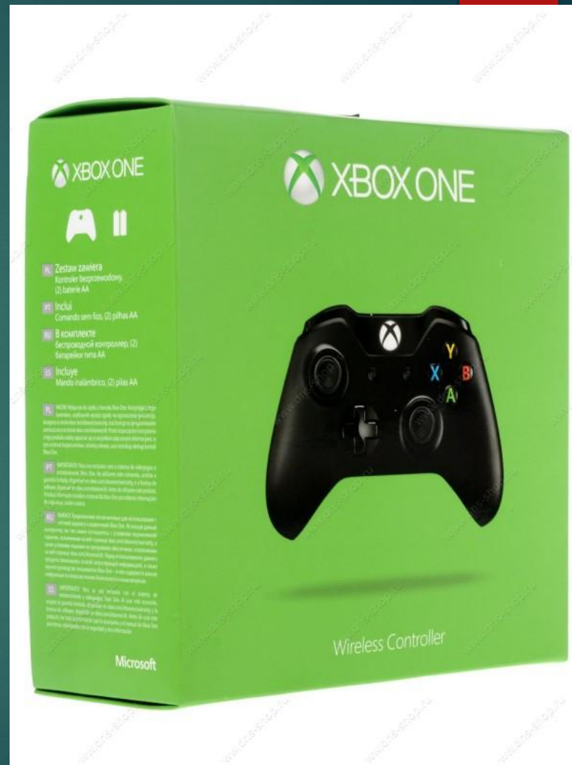
Геймпад для игровой приставки Xbox One от Microsoft