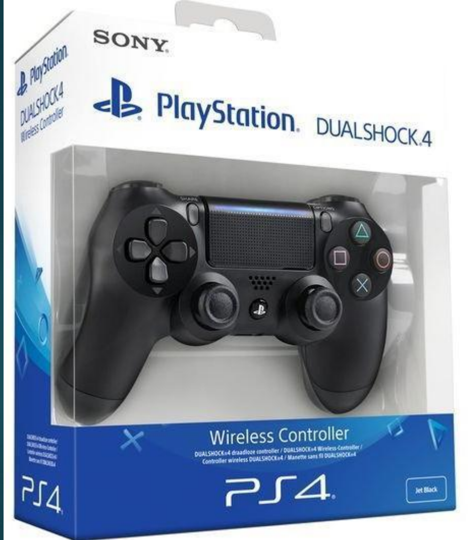
Dualshock 4 – геймпад для Sony Playstation