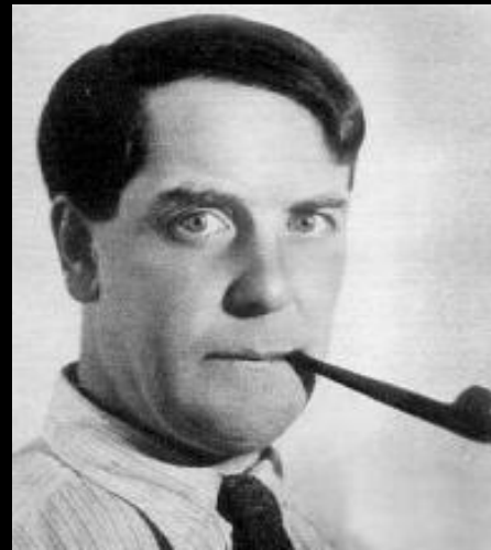
П. Капица (микрофизика)