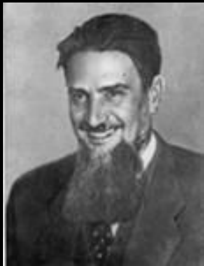
И. Курчатов (ядерная физика)