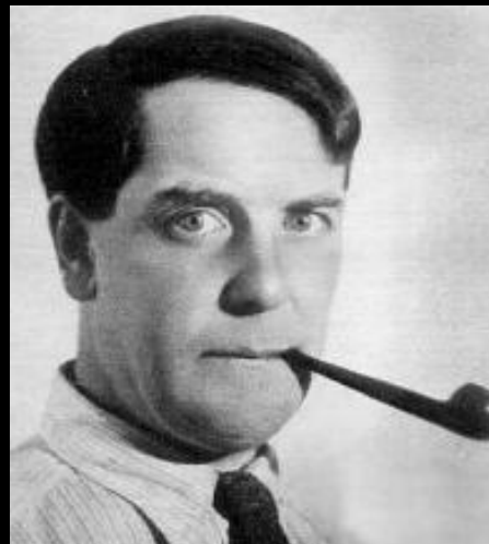
П. Капица (микрофизика)