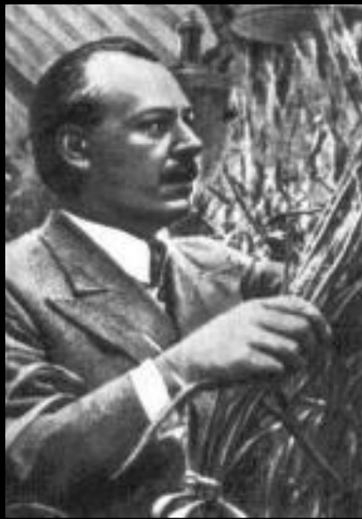
С. Вавилов (оптика)