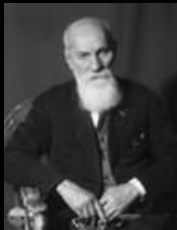
А. Н. Бах