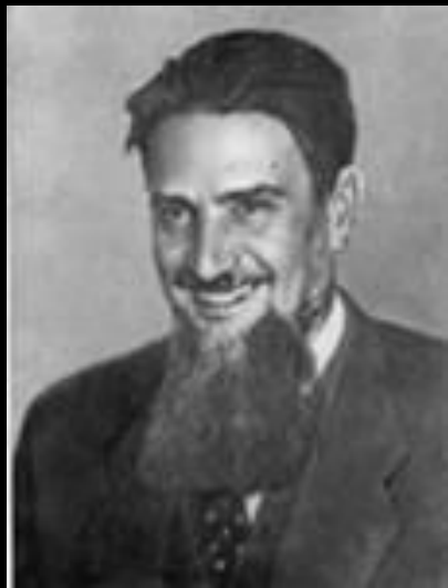
И. Курчатов (ядерная физика)