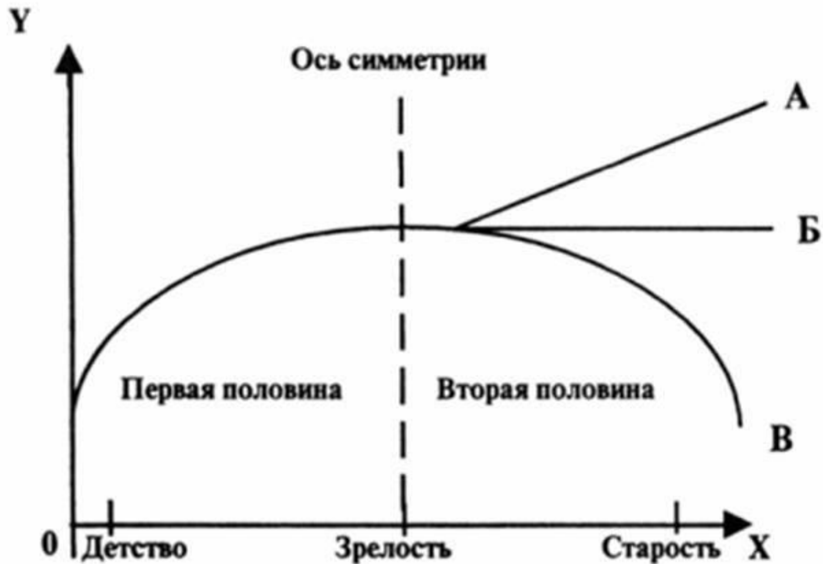
Рис. 4.4. Динамика статусного портрета человека: симметричность первой и второй половины жизни