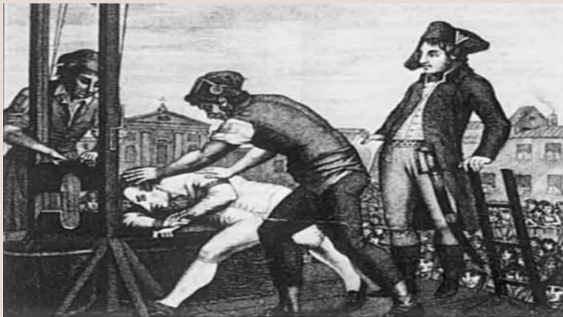
Казнь Максимилиена Робеспьера (10 термидора II года) 28 июля 1794