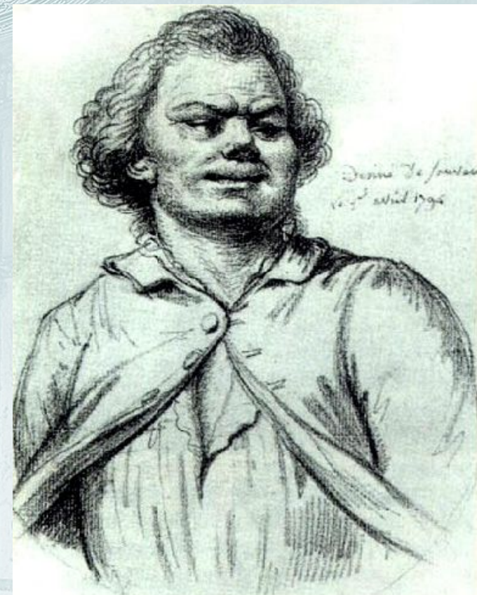
Дантон перед казнью

истинных виновников голода спекуляции 0,1% .