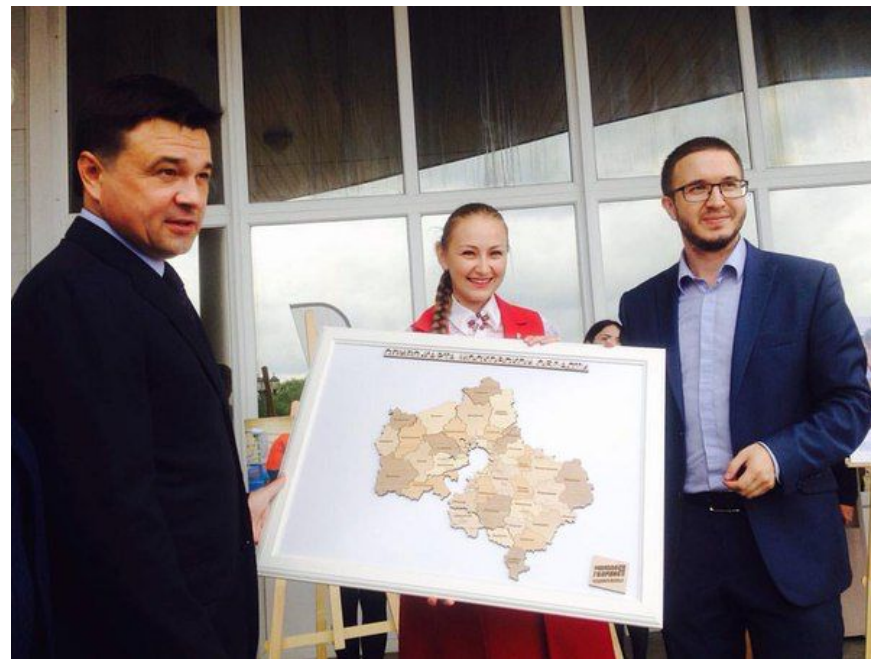
презентация программы Губернатору Московской области