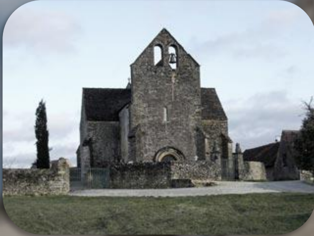
Eglise de Cazenac