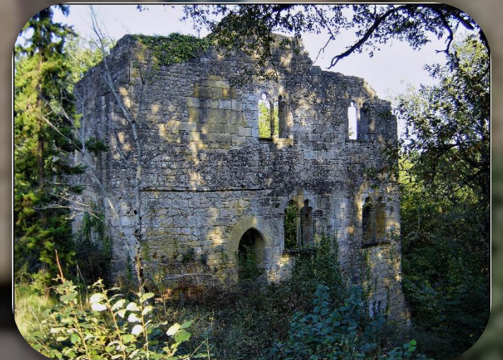
Ruines d' Abrillac

Cette église gothique avec des fenêtres intéressantes dans la tour avec des illustrations de scènes de la vie rurale.