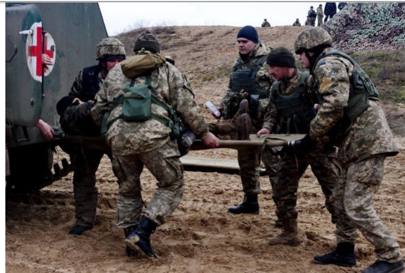
Оказание ПМП в боевых действиях