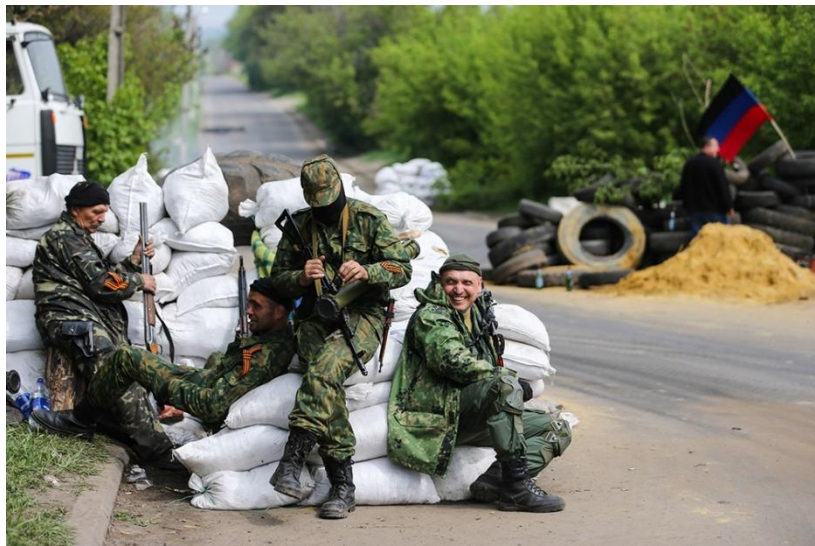
Охранение в оперативном тылу