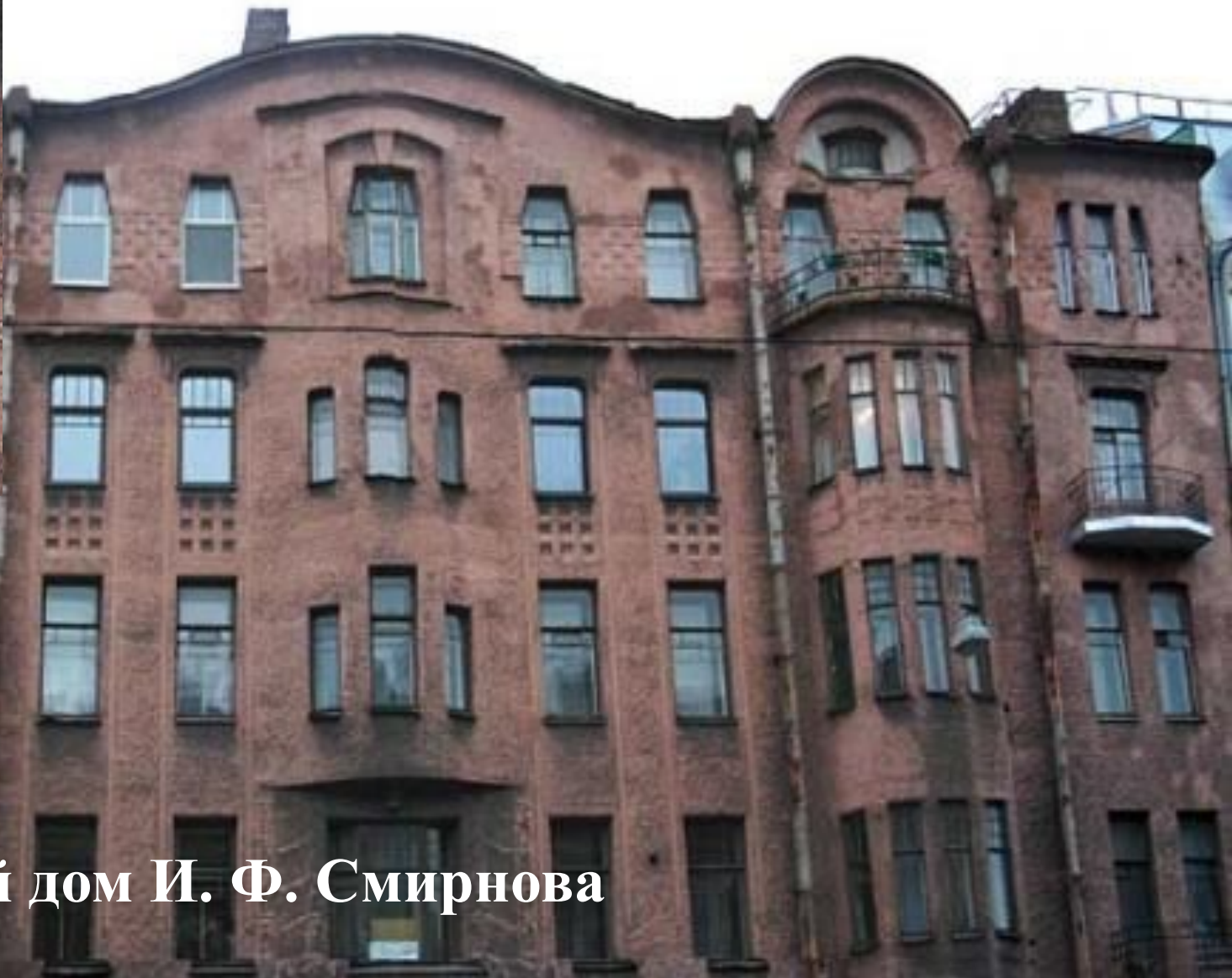
Доходный дом И. Ф. Смирнова