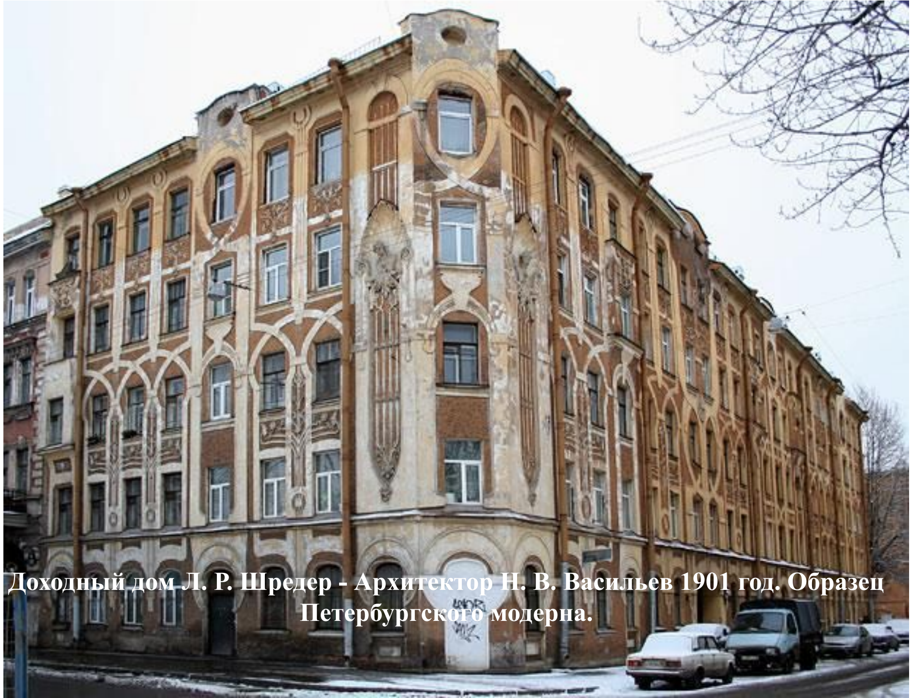
Доходный дом Л. Р. Шредер - Архитектор Н. В. Васильев 1901 год. Образец Петербургского модерна.