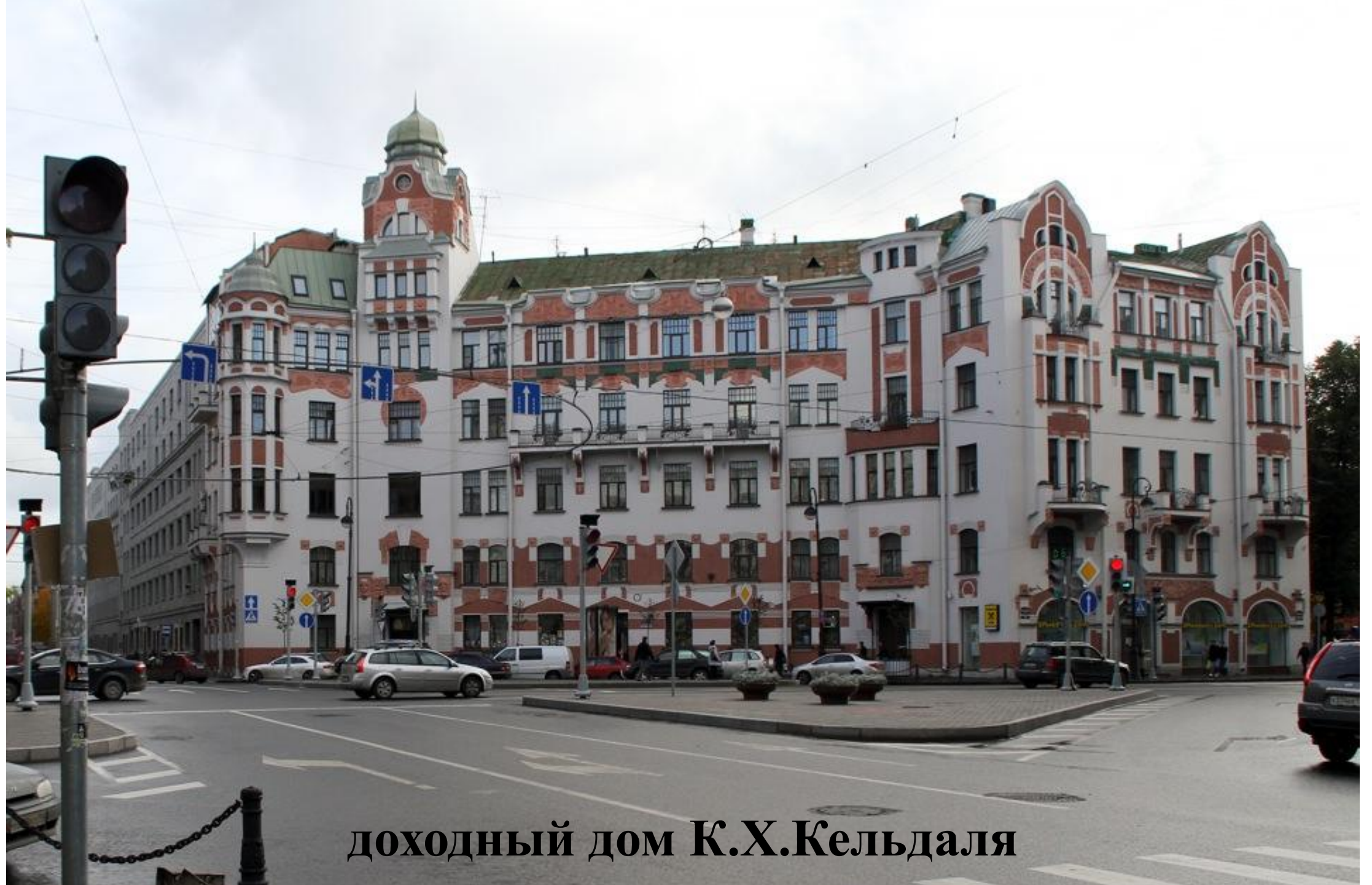
доходный дом К.Х.Кельдаля