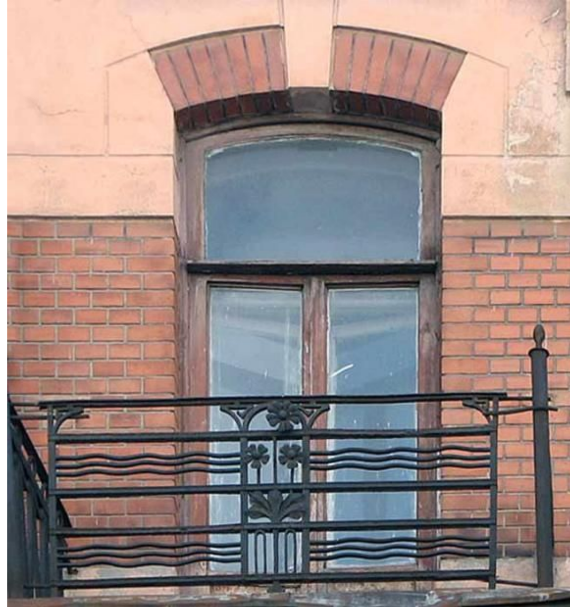
Доходный дом купца П. Я. Прохорова