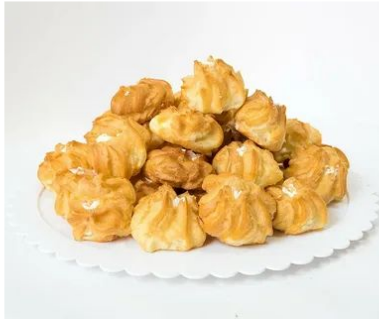
Крем - брюле