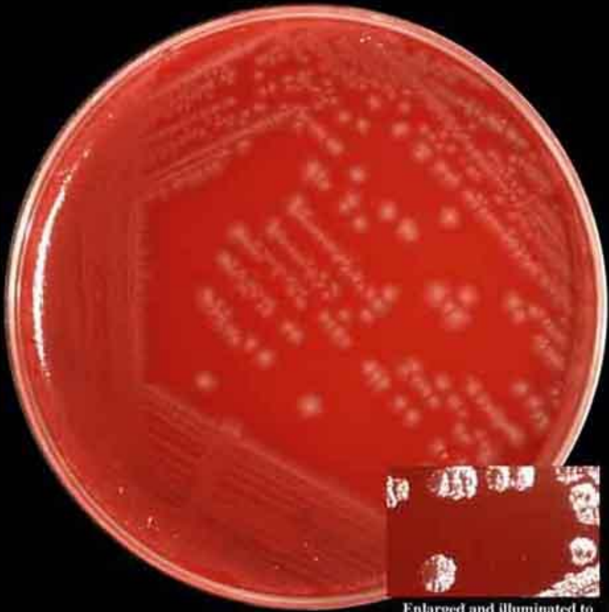
Enlarged and illuminated to show colony morphology