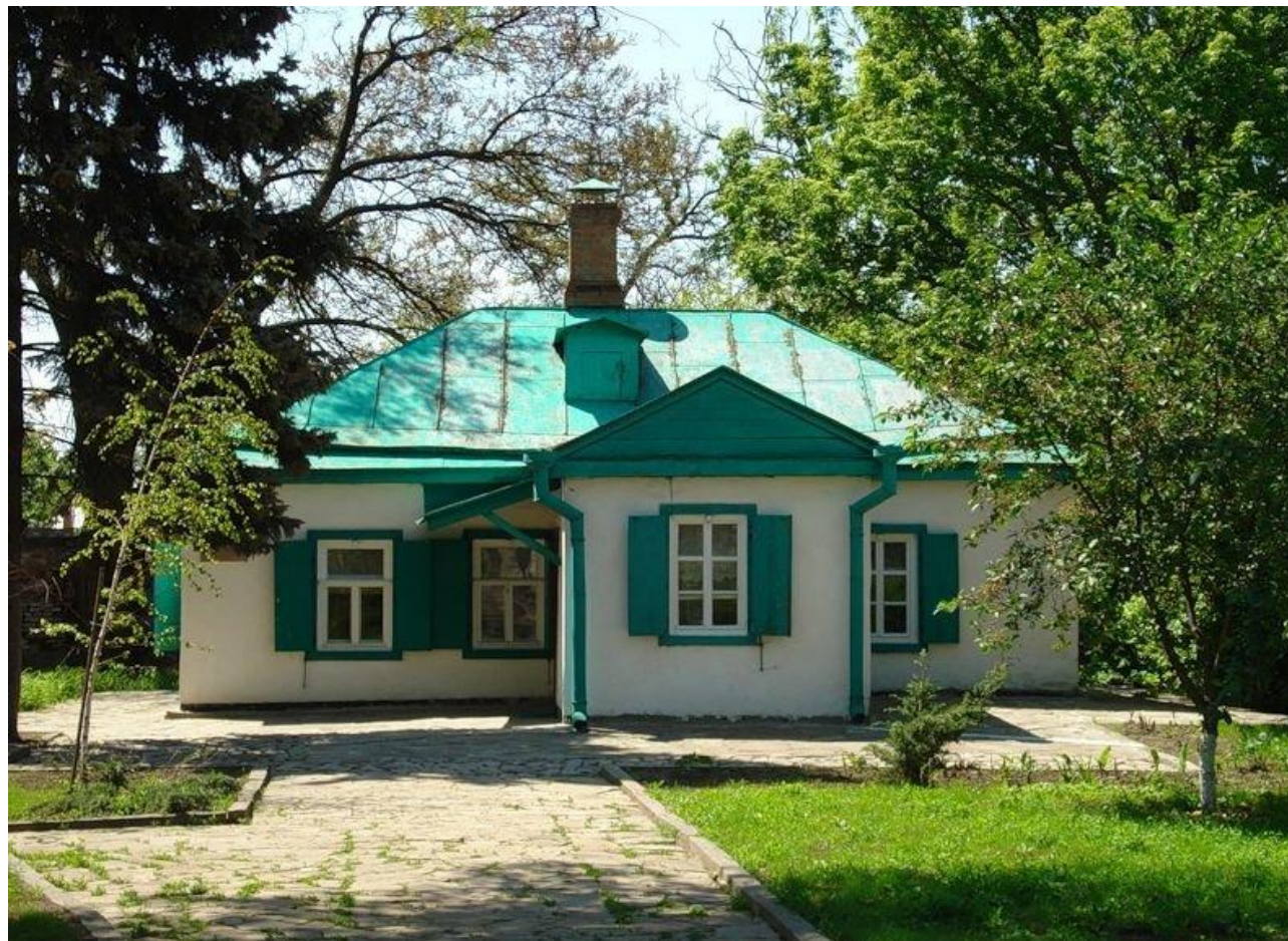
Дом - усадьба в Таганроге