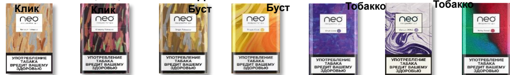
нео Деми Смуз нео Деми Крими нео Деми Брайт нео Деми Тропик нео Деми Фрут нео Деми Ванилла нео Деми Руби нео Деми Берри нео Деми Тропик Лут нео Деми Полярная нео Деми Сибирская