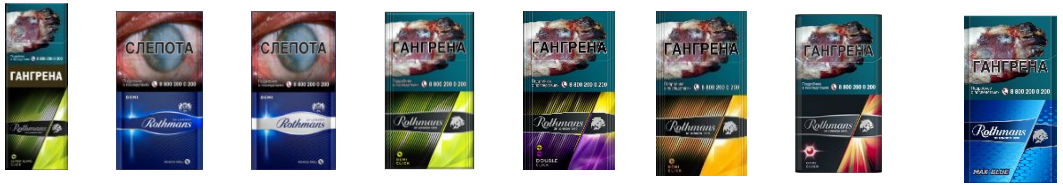
Rothmans Super Slims Click Rothmans Demi Rothmans Demi Silver Rothmans Demi Click Rothmans Аэро Блю Rothmans Деми Амбер Rothmans Деми Меллоу Rothmans МАКС Блю