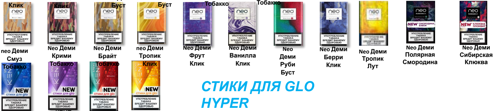
нео Деми Смуз нео Деми Крими нео Деми Брайт нео Деми Тропик нео Деми Фрут Клик нео Деми Ванилла Клик нео Деми Руби Буст нео Деми Берри Клик нео Деми Тропик Лут нео Деми Полярная Смородина нео Деми Сибирская Клюква