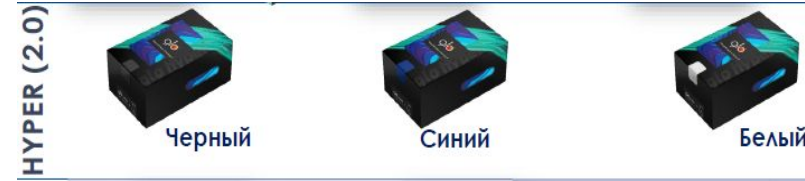
HYPER (2.0) Черный Синий Белый