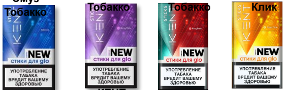
КЕНТ Стикс КЕНТ Стикс КЕНТ Стикс КЕНТ Стикс