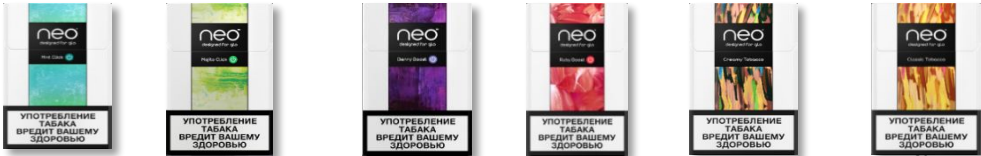
Нео Мент Нео Мохито Нео Берри Буст Нео Руби Буст Нео Крими Табакко Нео Классик Табакко