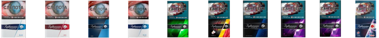
Rothmans Royals Блю Rothmans Royals Ред Rothmans Royals Деми Rothmans Royals Деми Класс. Rothmans Royals Грин Rothmans Royals Клик Rothmans Royals Нано Rothmans Royals Нано Клик Rothmans Royals Фиолет Rothmans Royals VOLT