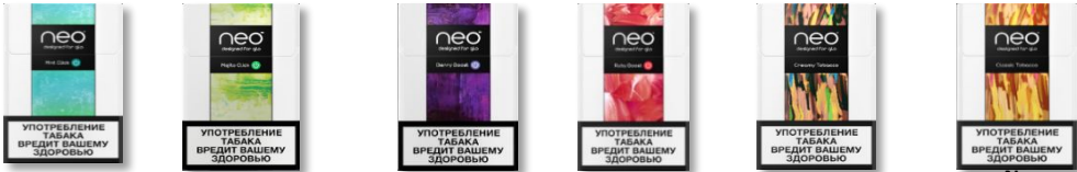
Нео Мент Нео Мохито Нео Берри Буст Нео Руби Буст Нео Крими Табакко Нео Классик Табакко