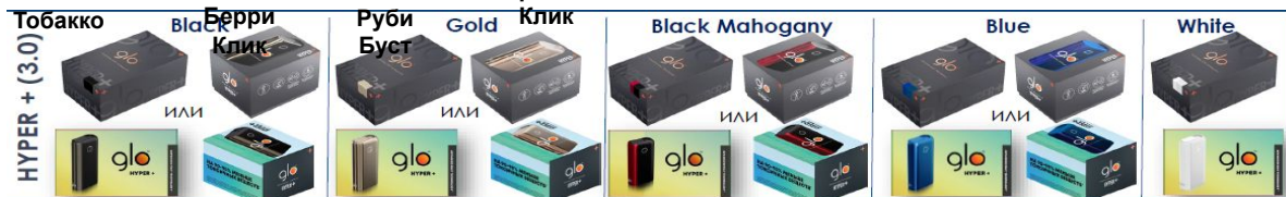
HYPER (3.0) Black Маhogany Blue White