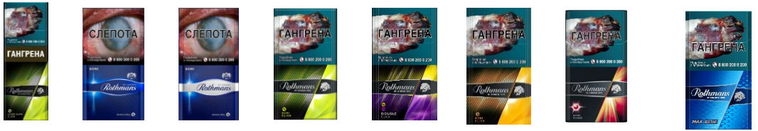
Rothmans Super Slims Click Rothmans Demi Rothmans Demi Silver Rothmans Demi Click Rothmans Аэро Блю Rothmans Деми Амбер Rothmans Деми Меллоу Rothmans МАКС Блю