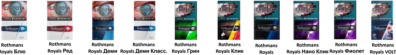
Rothmans Royals Блю Rothmans Royals Ред Rothmans Royals Деми Rothmans Royals Деми Класс. Rothmans Royals Грин Rothmans Royals Клик Rothmans Royals Нано Rothmans Royals Нано Клик Rothmans Royals Фиолет Rothmans Royals VOLT