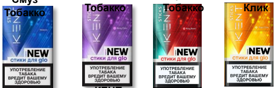
КЕНТ Стик Табакко КЕНТ Стик Берри Клик КЕНТ Стик Руби Буст КЕНТ Стик Тропик Клик