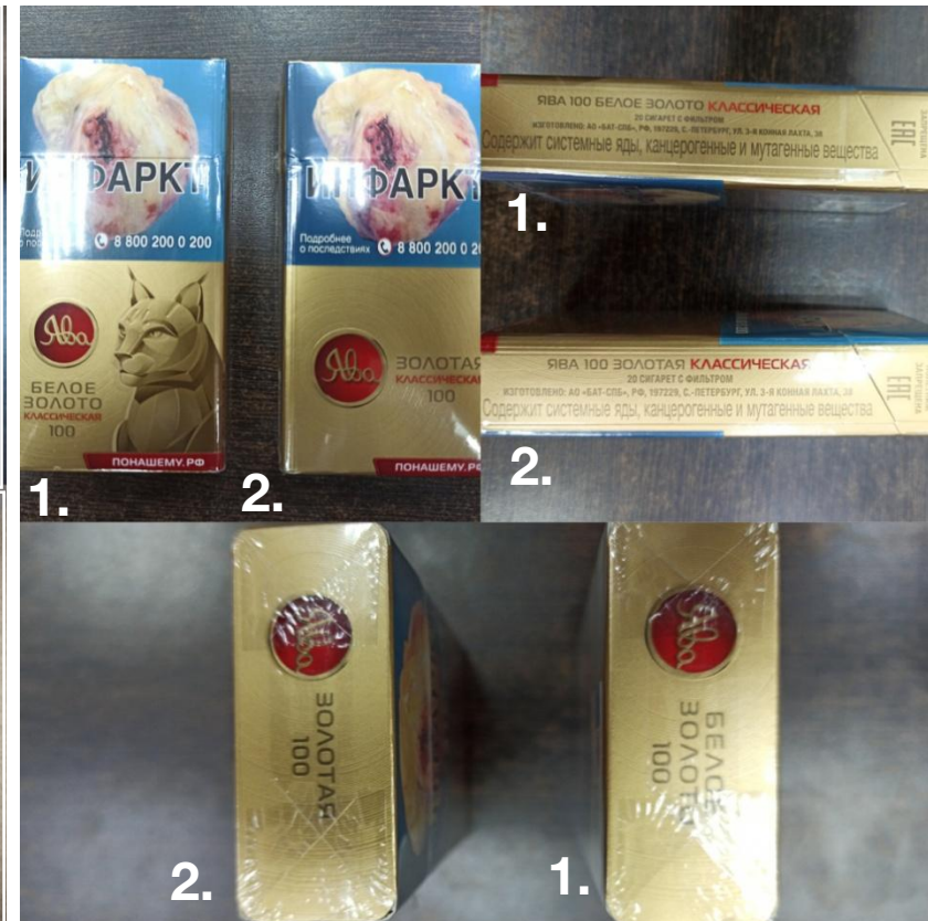
1. Ява 100 Белое Золото Классическая