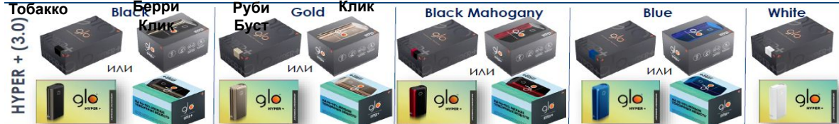
HYPER + (3.0) Табакко Или Black Mahogany Blue White