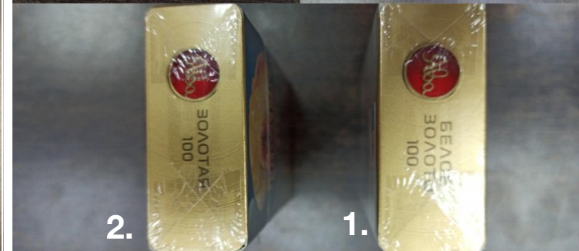
1. Ява Белое Золото Классическая