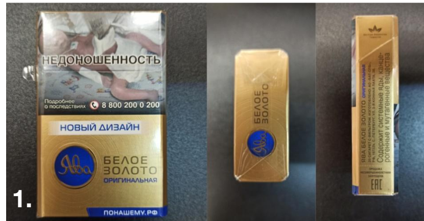
1. Ява Белое Золото Оригинальная