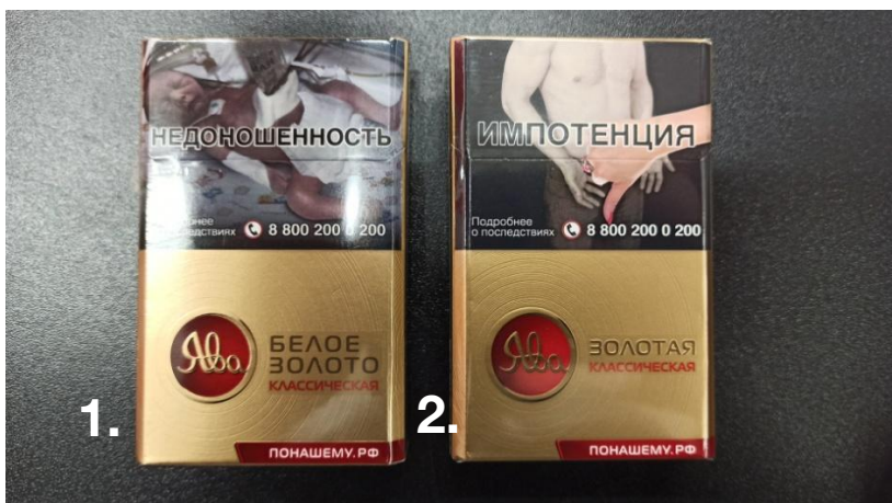
1. Ява Белое Золото Классическая