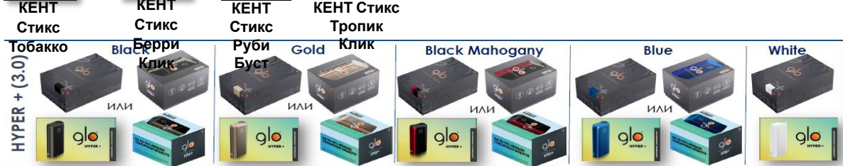
HYPER + (3.0) Тобакко Берри Клик Руби Буст Gold Клик Black Mahogany Blue White