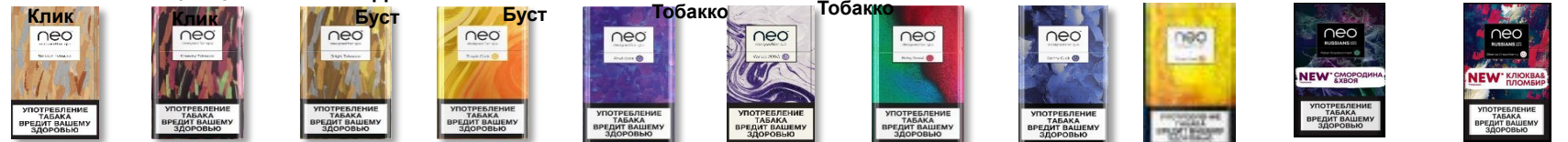
нео Деми Смуз Табакко нео Деми Крими Табакко нео Деми Брайт нео Деми Тропик нео Деми Фрут Клик нео Деми Ванилла Клик нео Деми Руби Буст нео Деми Берри Клик нео Деми Тропик Лут нео Деми Полярная Смородина нео Деми Сибирская Клюква