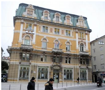
Gradska knjižnica Rijeka