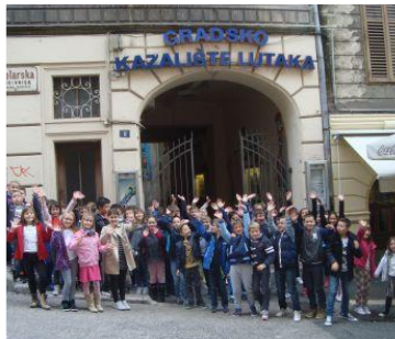
Gradsko kazalište Lutaka .