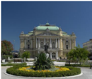
Narodno kazalište Ivana, Zajca.