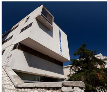
Muzej Grada Rijeka