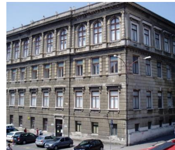
Muzej moderne i suvremene umjetnosti.