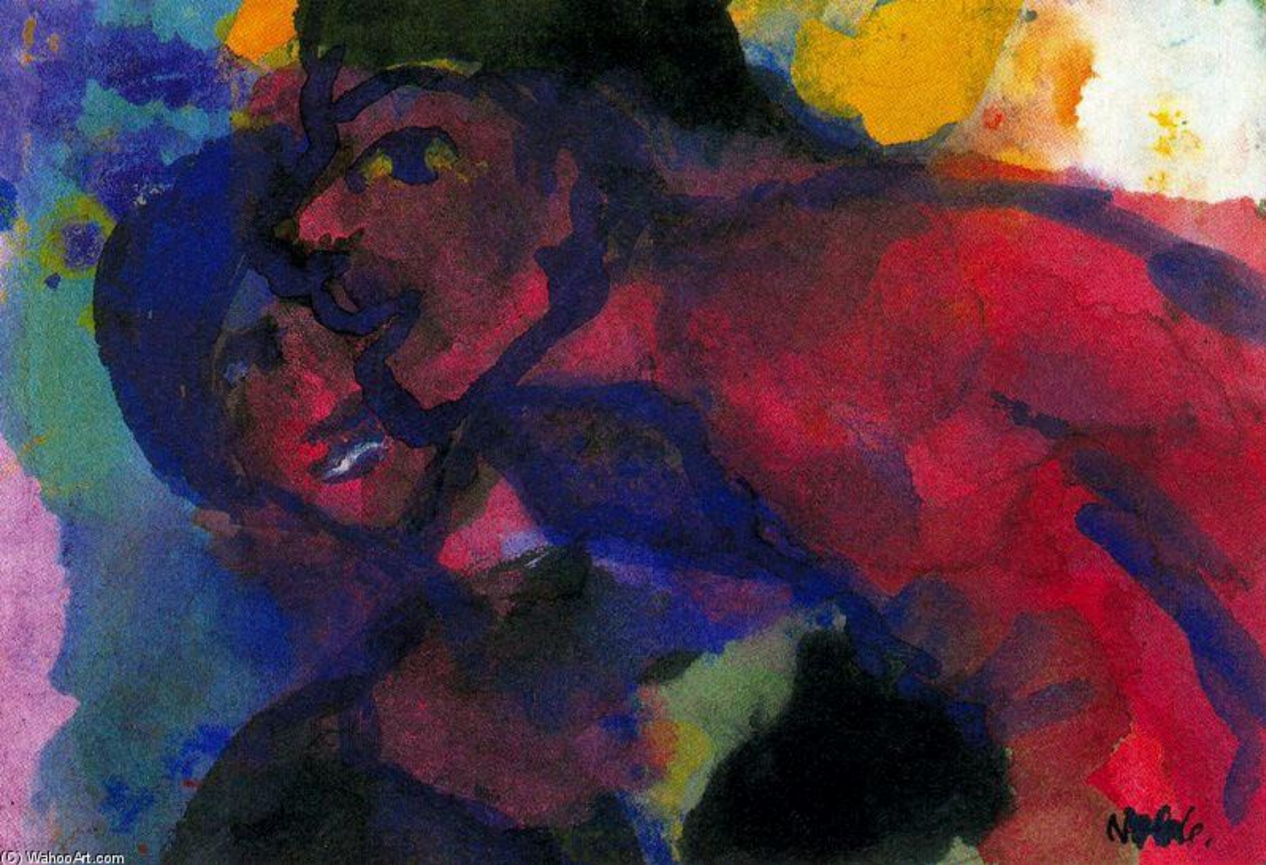
Мужчина и женщина