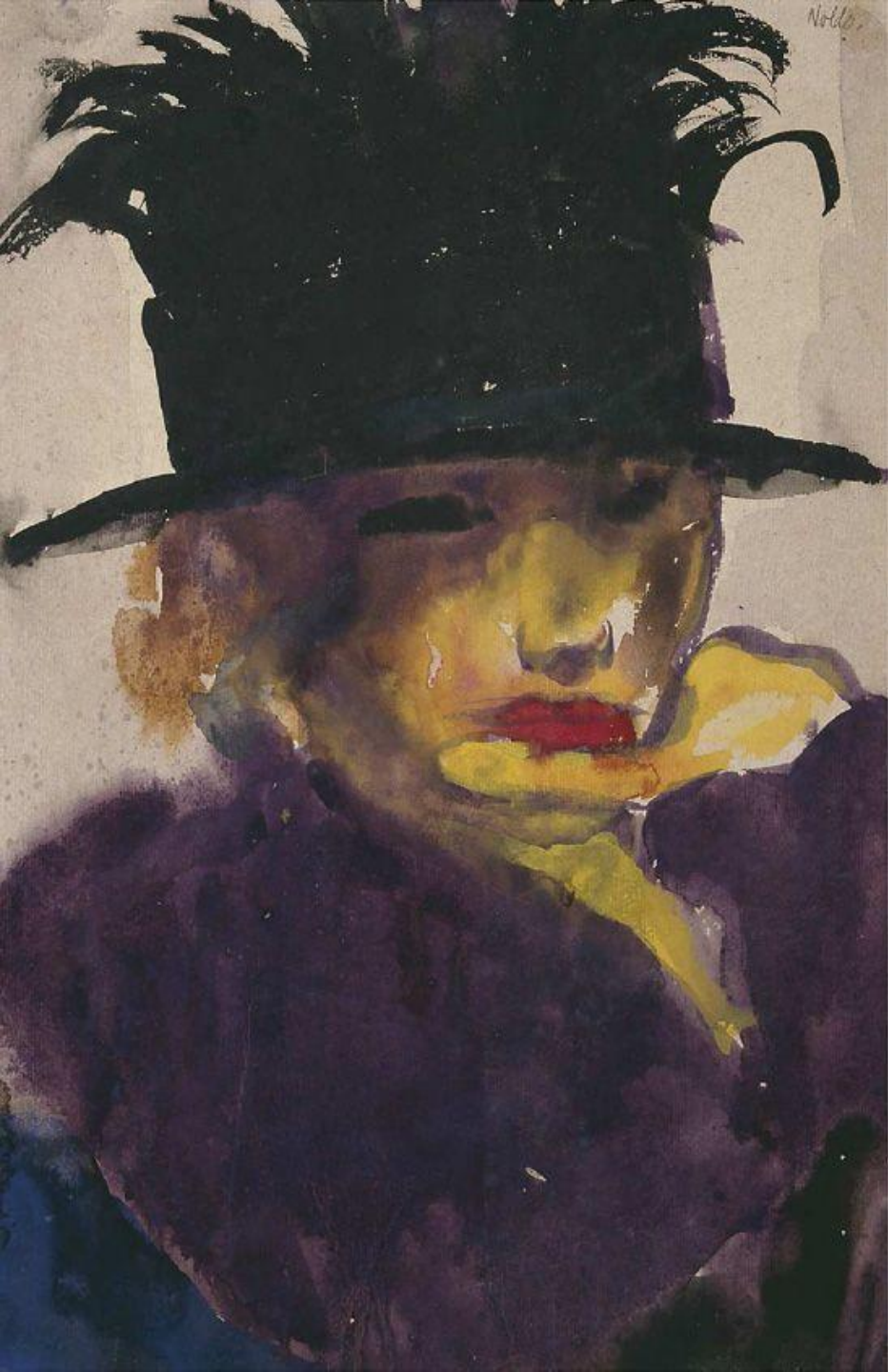
Портрет молодой женщины в шляпе