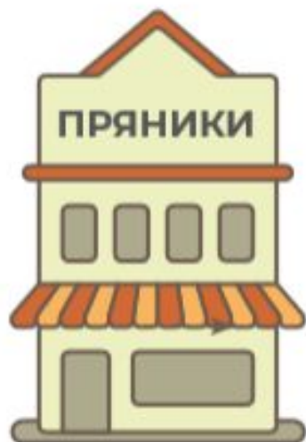
Косшыгулов и сыновья — поставщик Двора его Императорского Величества