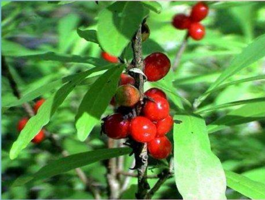
Волчье лыко. Ягоды