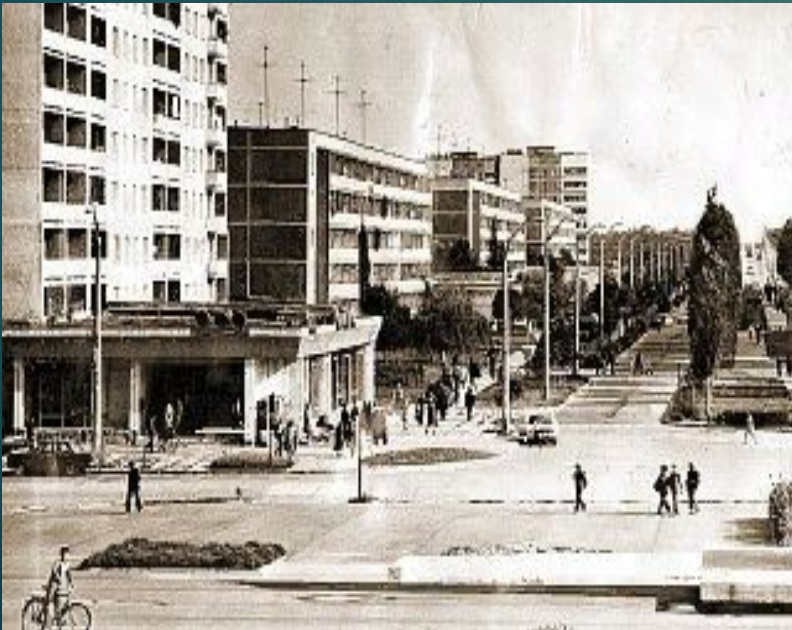
Припять до аварии

Припять находится в 94 км от Киева и в двух километрах от ЧАЭС. Своё название город получил от одноимённой реки, на берегах которой он стоит. Населённый пункт Припять был основан в 1970 году для проживания людей, занятых строительством и дальнейшим обслуживанием ЧАЭС. Электростанции присвоили имя «Чернобыльская» по названию районного центра. Сам Чернобыль, расположенный в 18 километрах от ЧАЭС, не имеет к ней прямого отношения.