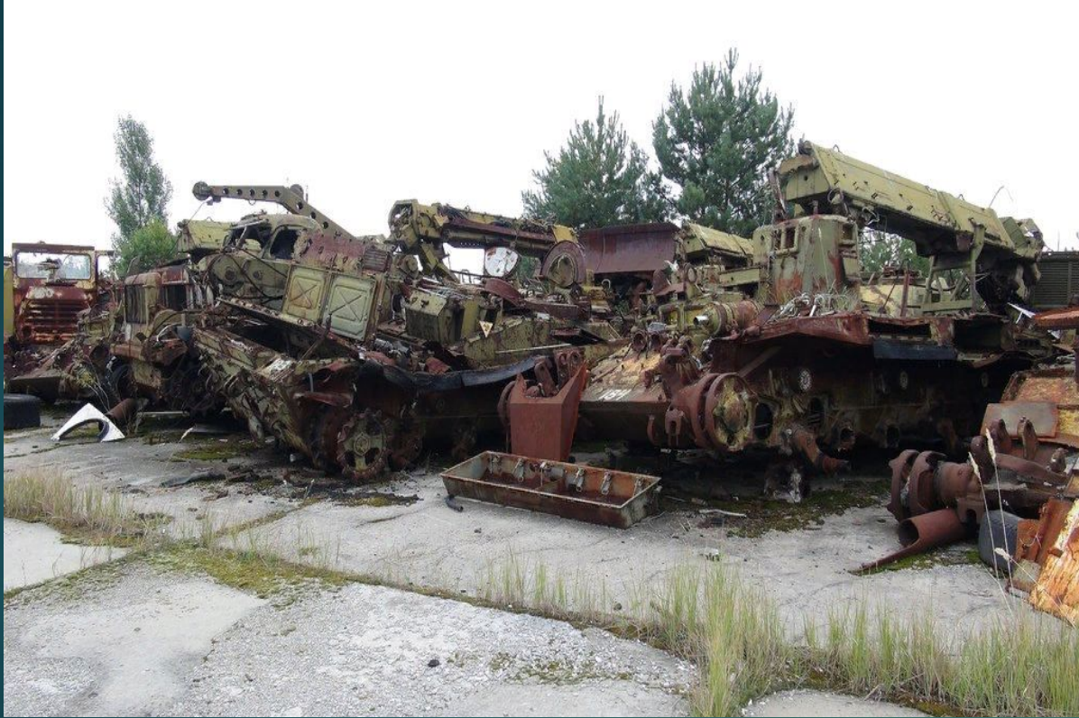
Свалка радиоактивной техники

Зона отчуждения — местность, расположенная в диаметре 30 километров от эпицентра аварии. В окрестностях зоны проводятся экскурсии с посещением домов самосёлов, фермеров и своеобразных музеев. Из-за того, что это место стало очагом нелегального туризма, в последнее время ужесточились правила проезда в зону и нахождения в ней. Как ни странно, в местных лесах обитает множество животных: зайцы, кабаны, рыси, лошади, медведи, барсуки, косули, волки. Вопреки всем негативным прогнозам, птицы и звери не мутировали, природа выстояла и расцвела благодаря отсутствию влияния человека.