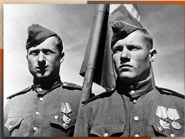
Мелитон Варламович Кантария

Герой Советского Союза, младший сержант РККА