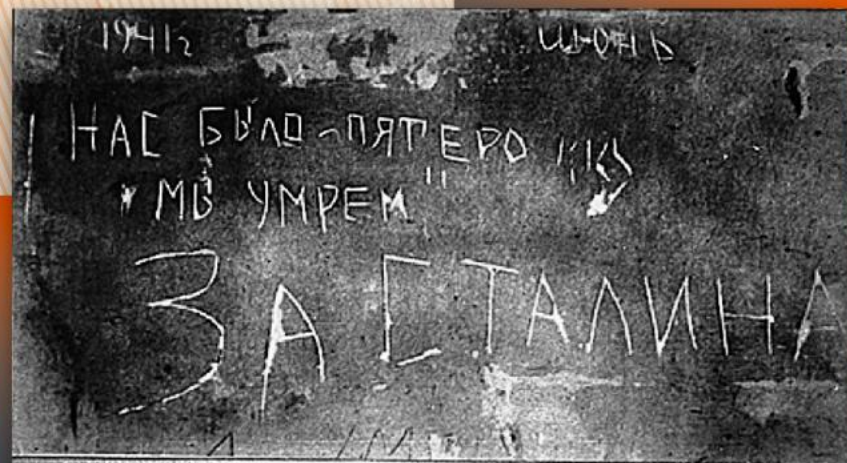
Одна из надписей на стенах Брестской крепости, сделанная группой советских воинов, участников героической обороны крепости.