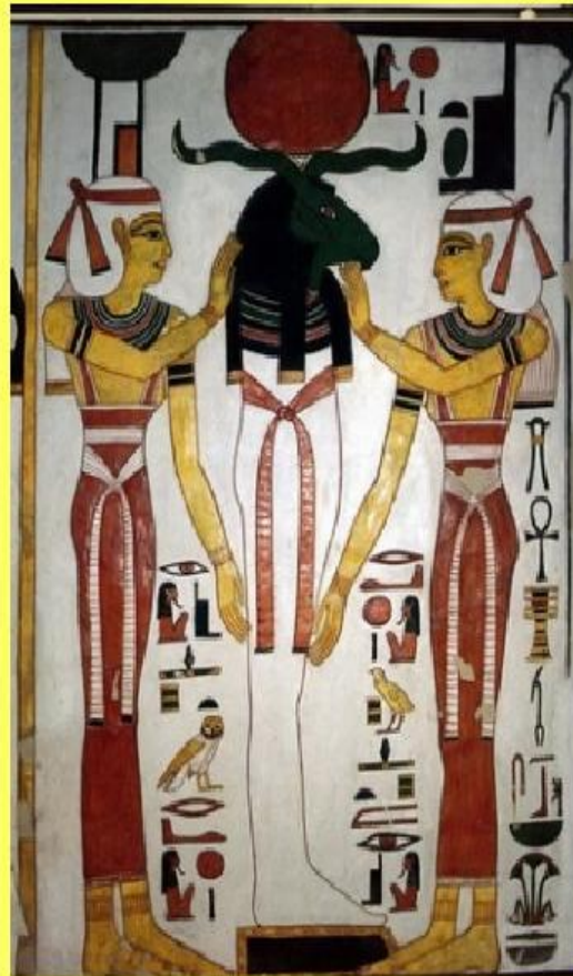
Осирис с головой барана