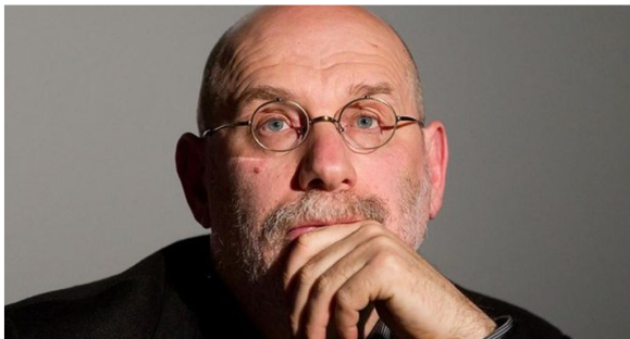
Борис Акунин, русский писатель