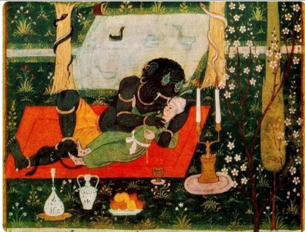
Иллюстрация ифрита, обнимающего Махана, персонажа из персидской поэмы Низами Гянджеви "Хамса" 12 века.