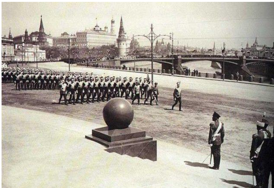
Николай II принимает парад во время церемонии открытия памятника Александрю III

Более широкое распространение военные парады получили в конце 18-го века. Например, 30 мая 1912-го года, когда неподалеку от Храма Христа Спасителя проходило открытие памятника императору Александру III, торжественное шествие военных подразделений, возглавляемое лично Николаем II, состоялось возле нового монумента.