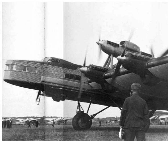
АНТ-20 «Максим Горький»

В ответ на начало милитаризации Германии и изменение политической ситуации в Европе в 1935-ом году Сталин решает продемонстрировать всю мощь советских военных сил. В первомайском параде участвовало пятьсот танков, в воздух поднялось восемьсот летательных аппаратов, флагманом которых стал восьмимоторный «Максим Горький», сопровождаемый двумя истребителями. Вслед за ними в несколько ярусов пролетели бомбардировщики, которые буквально закрыли небо над площадью своими крыльями.