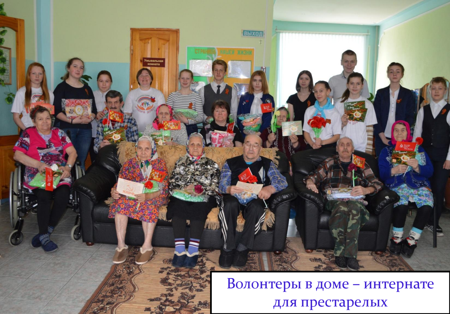
Волонтеры в доме – интернате для престарелых