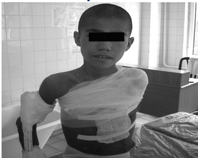
Вид больного при выписке