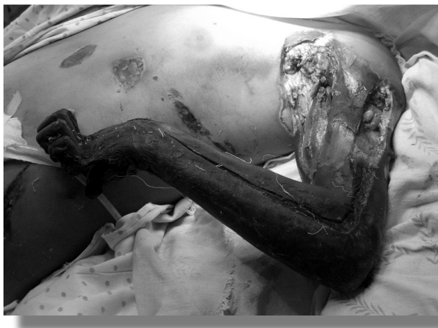
Гангрена левой верхней