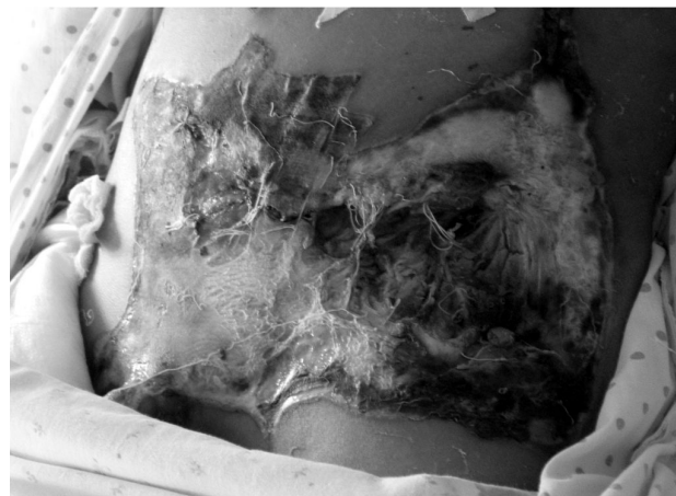
Формирование толстокишечного свища на ожоговой ране в левой подвздошной области