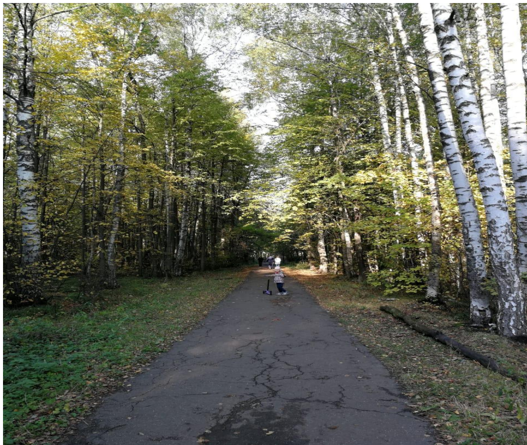
Грибочки в нашем лесочке