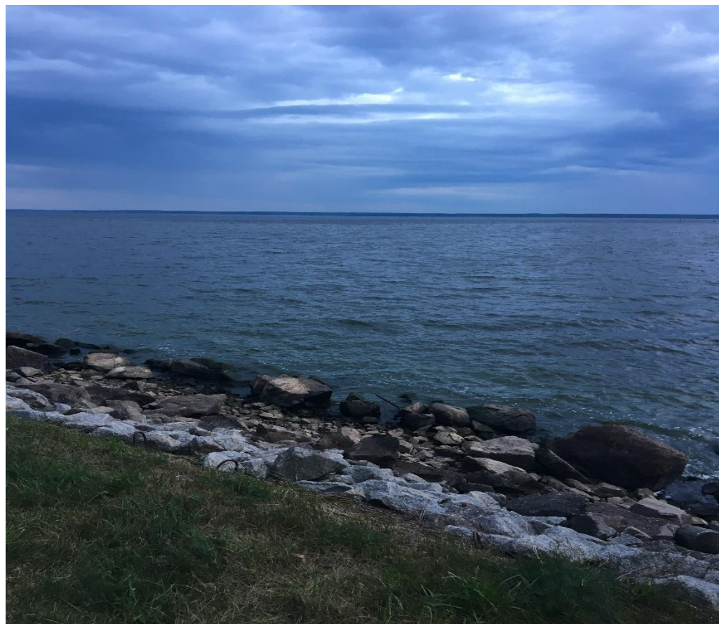
Дорожка вдоль взморья