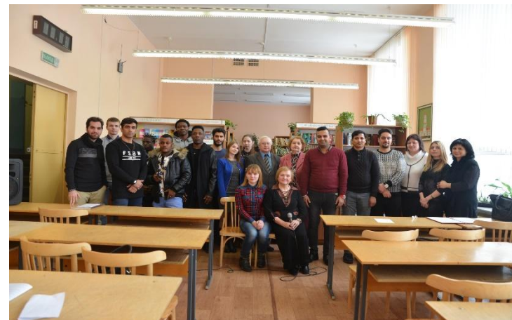
Дзень роднай мовы ў БДГУ 21.02.2018