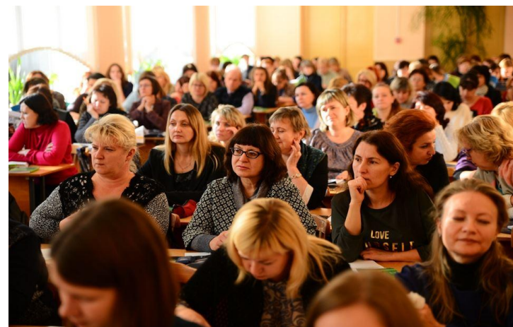
Бясплатны семінар для настаўнікаў (БДГУ кастрычнік 2017 г., прысутнічала 158 чалавек)