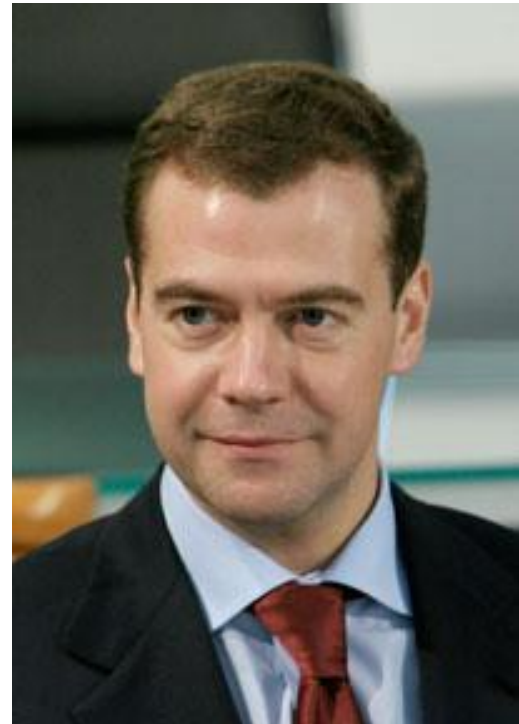
Медведев Дмитрий Анатольевич

Правительство состоит из Председателя Правительства РФ, Заместителей Председателя Правительства РФ и