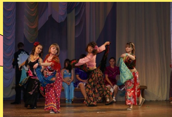
совместные культурные мероприятия