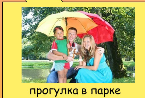
прогулка в парке