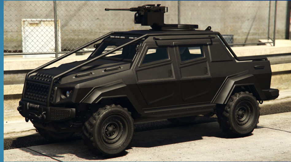
«неубиваемый» броневик из GTA 5