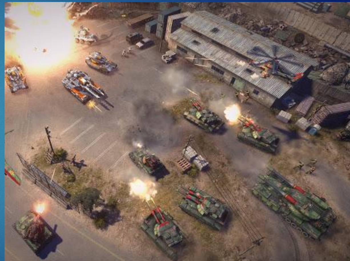
Command & Conquer: Generals 2 (игра так и не вышла)