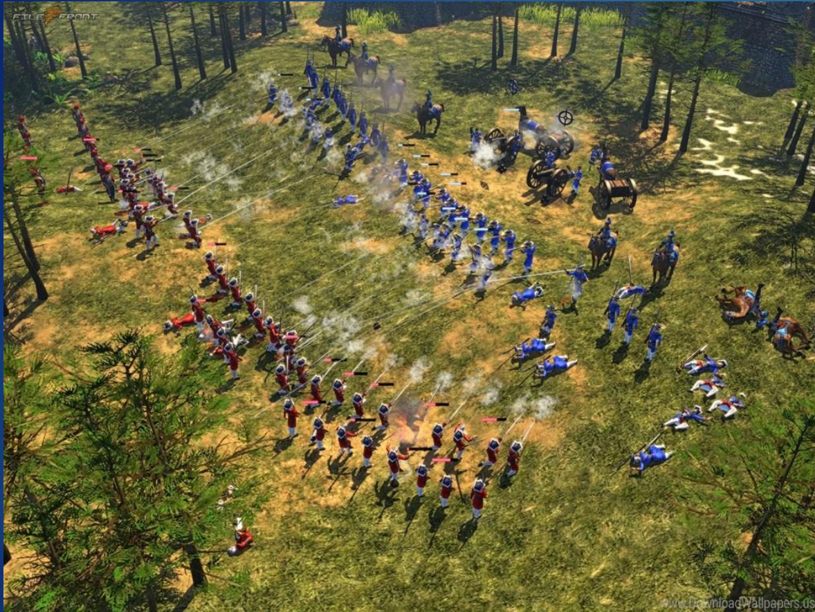
age of empires III