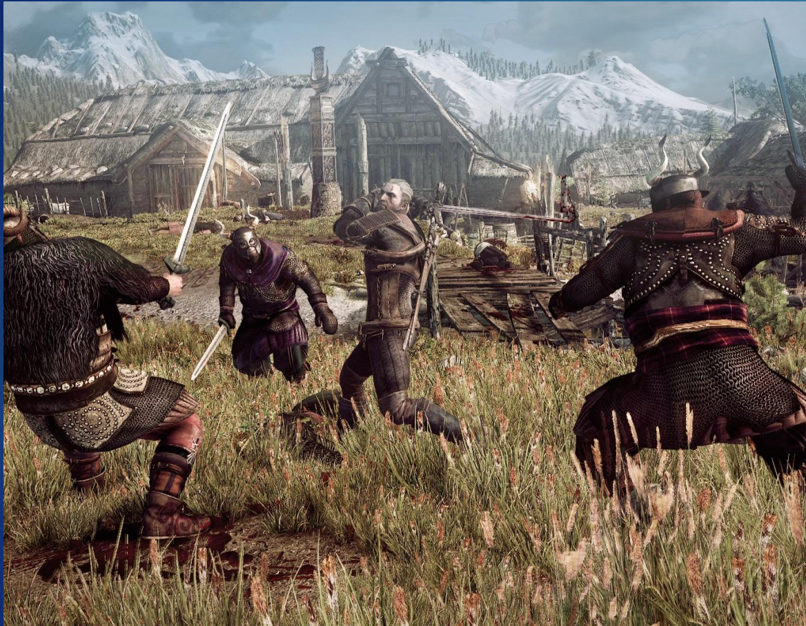
The Witcher 3