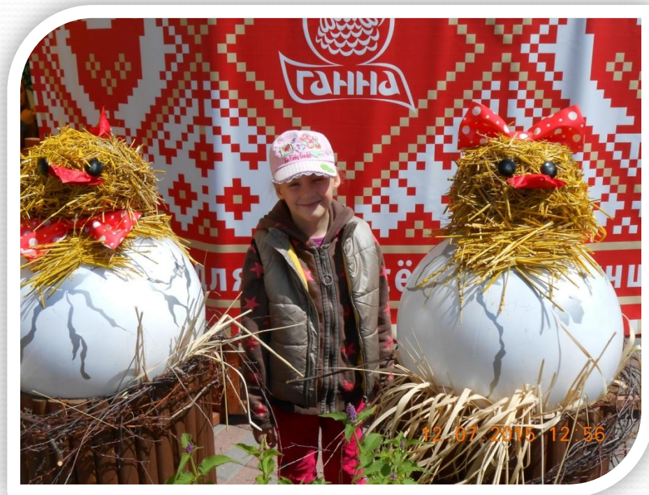
А это я среди цыплят.