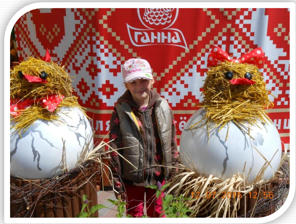
А это я среди цыплят.