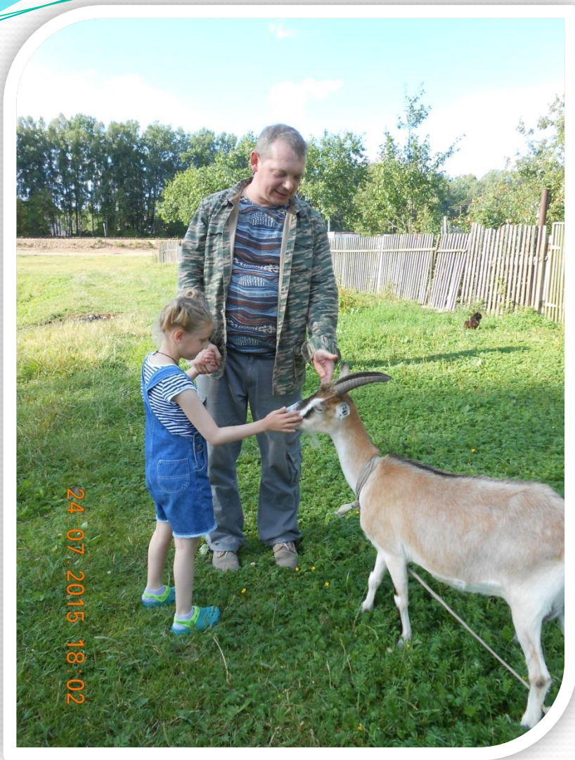
Это коза Машка.