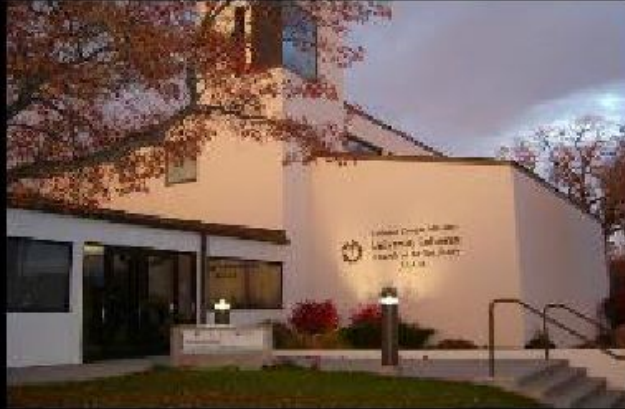
Мартин Лютер – основатель лютеранской церкви

1559 – «Наставление в христианской вере»