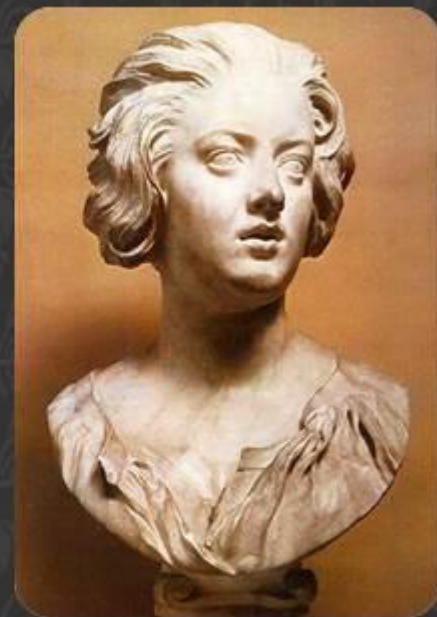
Портрет Констанцы Буонарелли (1635)