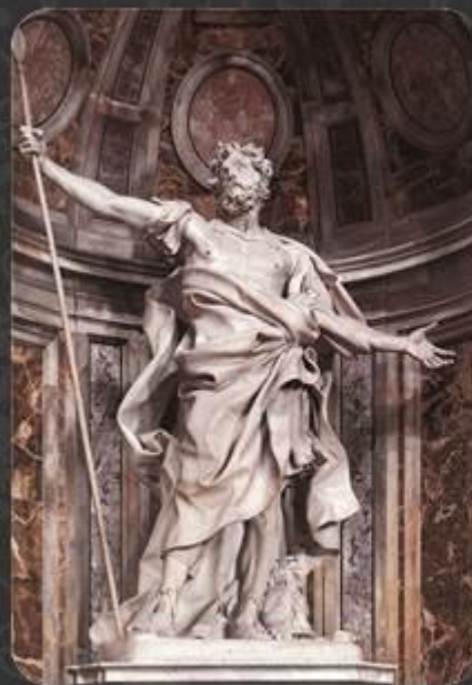
«Святой Лонгин» (1629—1638) в соборе Святого Петра