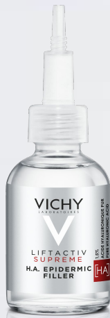
ЕПІДЕРМІК ФІЛЕР Антикірова сироватка для обличчя та зони навколо очей