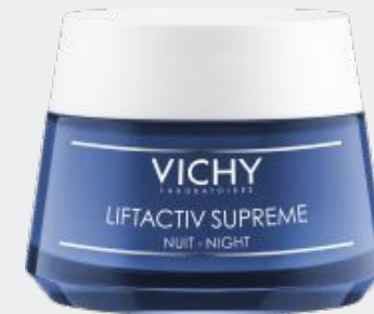
ЛІФТАКТИВ СЮПРЕМ Нічний засіб глобальної дії проти зморщок