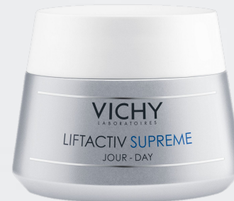
ЛІФТАКТИВ СЮПРЕМ Денний крем