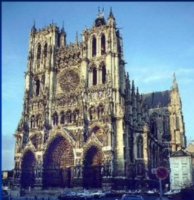
Собор Богоматери в Амьене, Франция