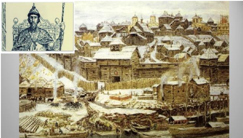
Московский Кремль при Иване Калите (1340 г.)

Древний Кремль – своеобразная архитектурная летопись Москвы. Ее каменные страницы – свидетели многих исторических событий.