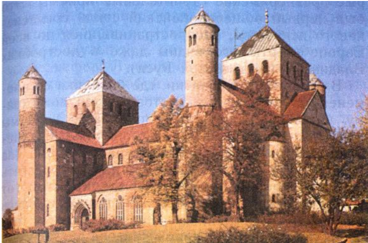
ЗАМОК СЮЛЛИ, СТРОИТЕЛИ НЕИЗВЕСТНЫ X-XI вв., ФРАНЦИЯ