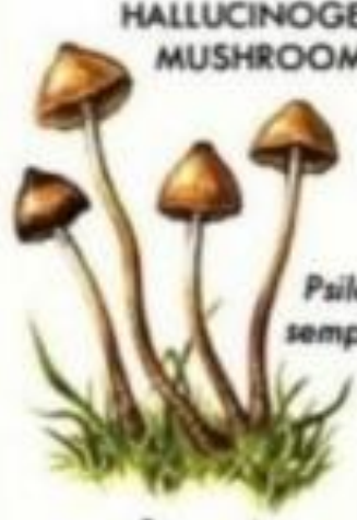
Psilocybe caeruleus var. mazatecorum