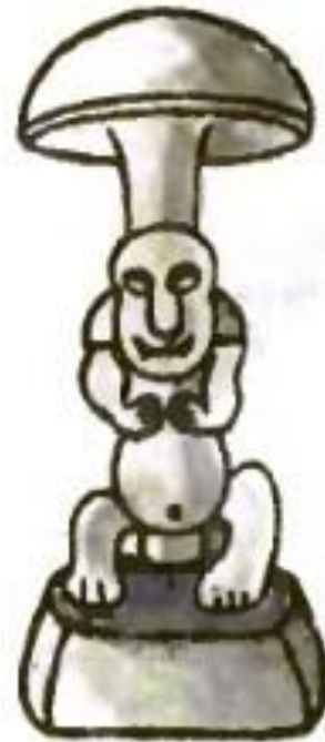
Скульптурное изображение гриба (Майя).