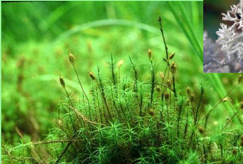
МОХ КУКУШКИН ЛЁН