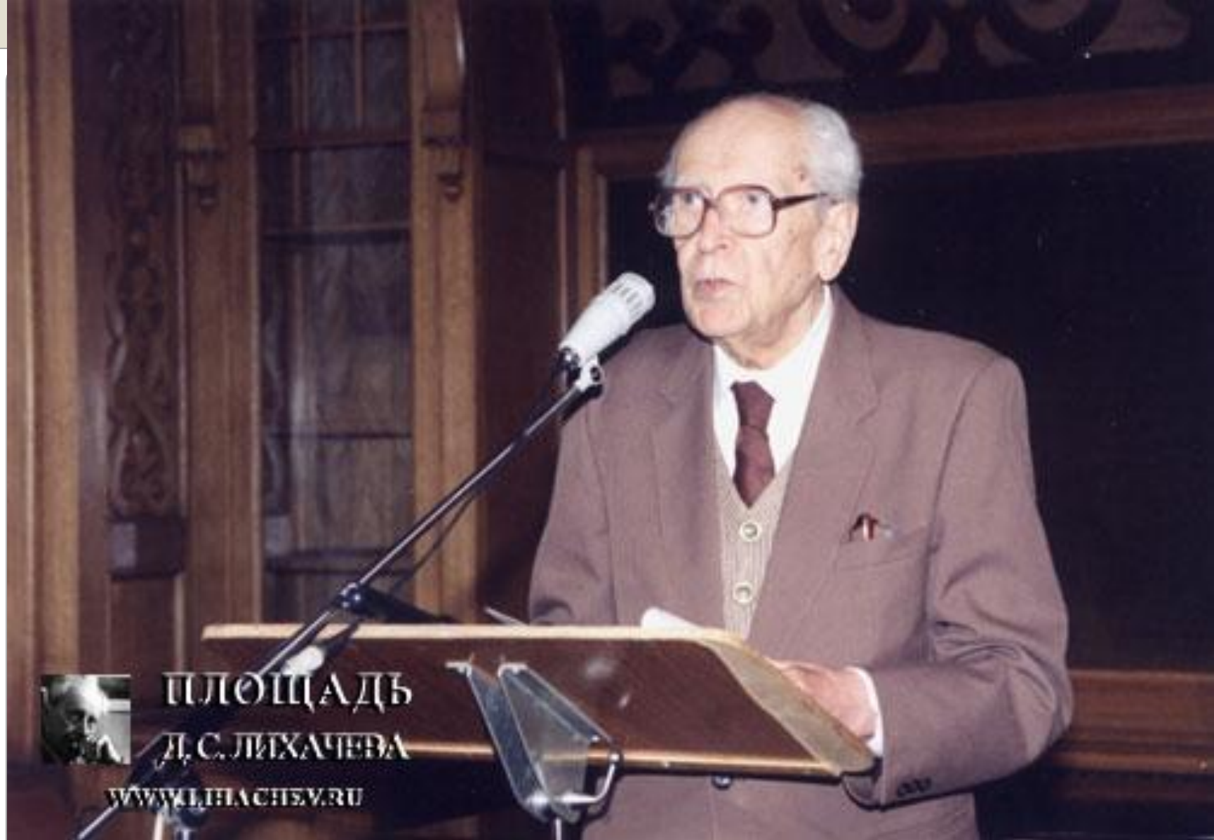
Д. С. Лихачёв. Дворец Белосельских – Белозерских. Дискуссия «Судьба российской интеллигенции» 23 мая 1996г.