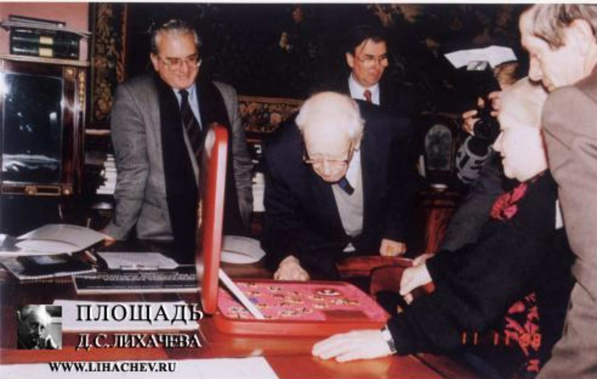
Церемония передачи Д.С. Лихачёвым ордена Св. Андрея первозванного в Эрмитаж. 11 ноября 1998г.