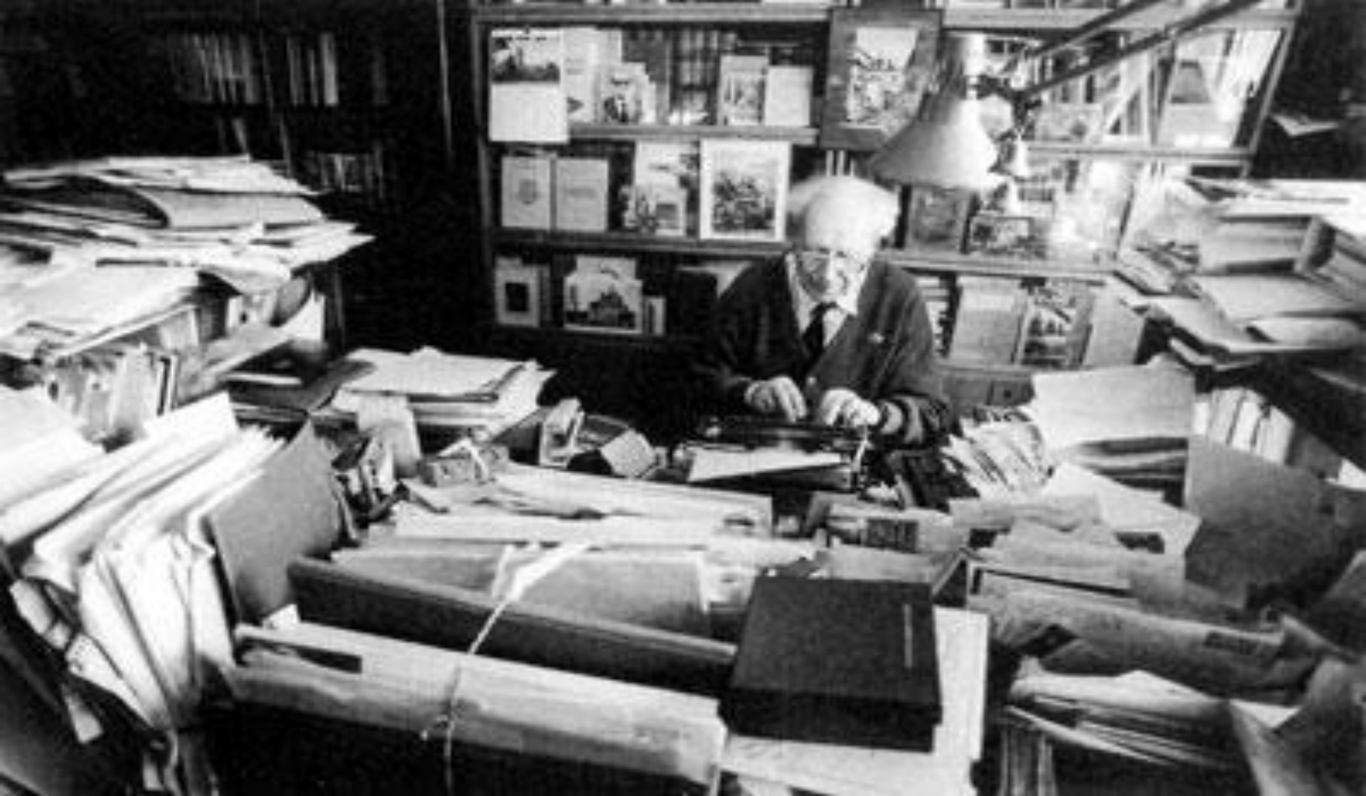
Д. С. Лихачёв в кабинете за работой. 1980-е гг.