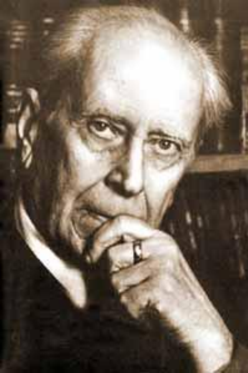
Дмитрий Сергеевич Лихачёв (1906-1999)