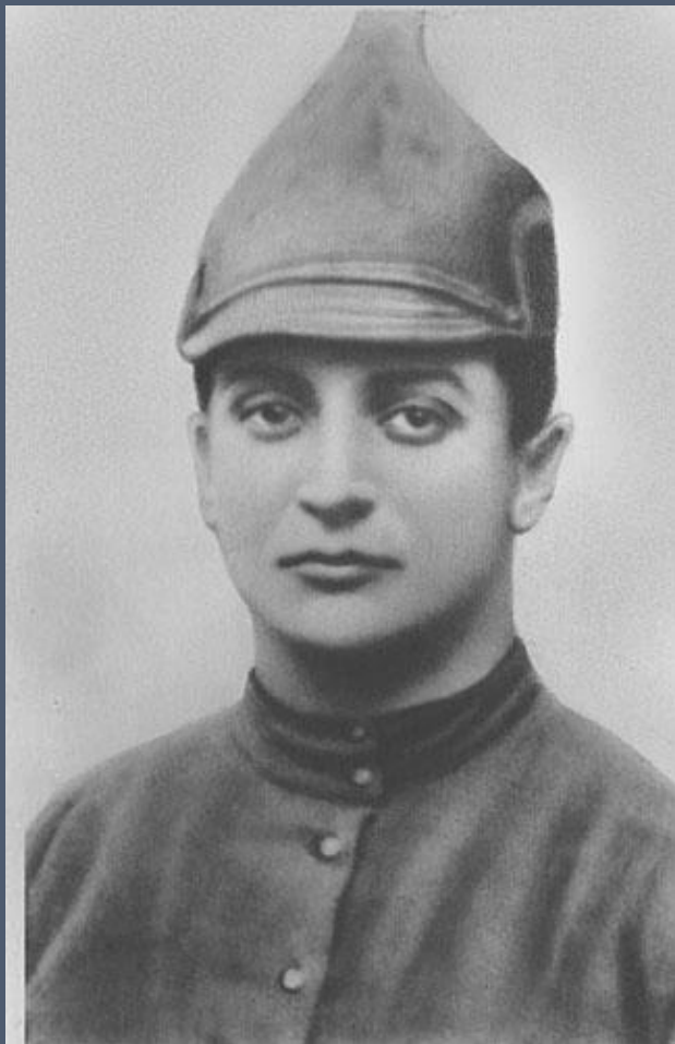
Тухачевский Михаил Николаевич