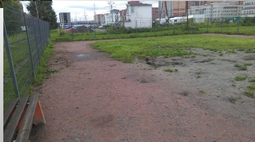
Угол Брестского бульвара и М.Казакова