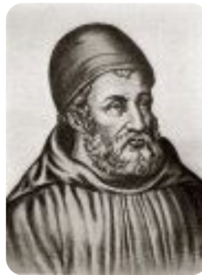
Иоанн Дунс Скот.