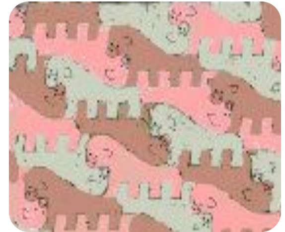
Джозеф Кошут Концептуализм Концепт США 529.

– именно документальная фиксация концепта и процесса его материализации; его реализация желательна, но не обязательна. Акцент в визуальных искусствах, таким образом, переносится из чисто визуальной сферы в концептуально визуальную, от перцепции к концепции, т.е. с конкретно чувственного восприятия на интеллектуальное осмысление.