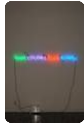
Четыре цвета, четыре слова (Дж. Кошут.