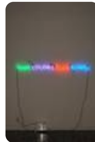
Четыре цвета, четыре слова (Дж. Кошут).