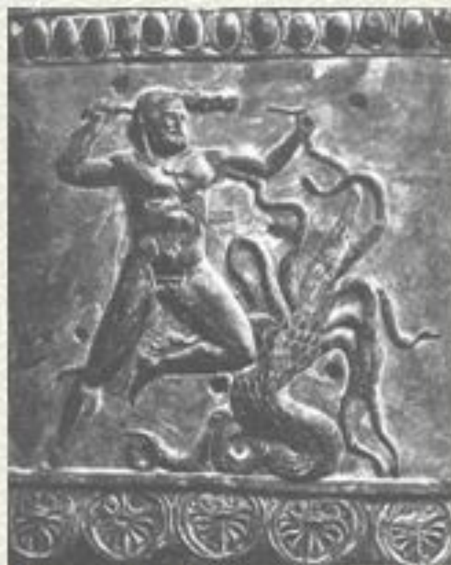
Геракл борется с лернейской гидрой.