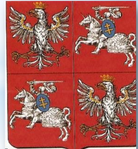
Герб Польши в Грюнвальдской битве