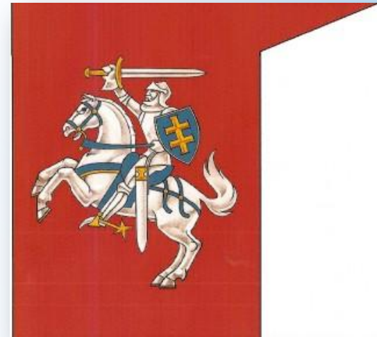
Хоругвь ВКЛ в Грюнвальдской битве