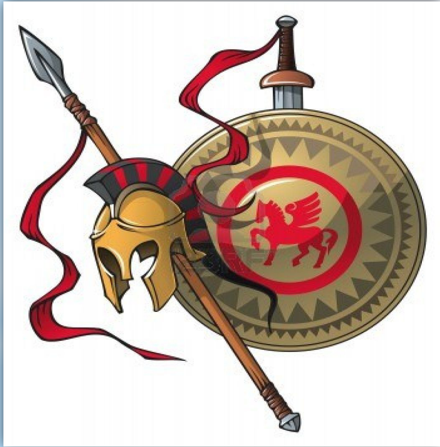
Копье , щит, шлем