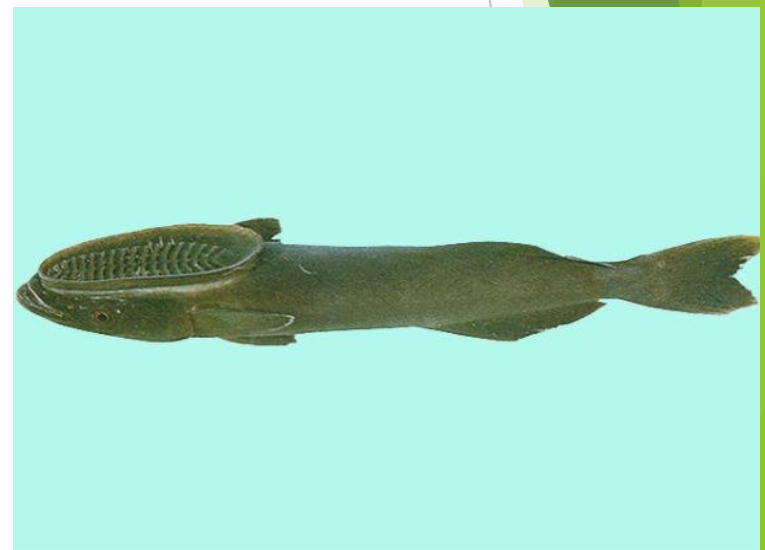
Акула и рыба-прилипала