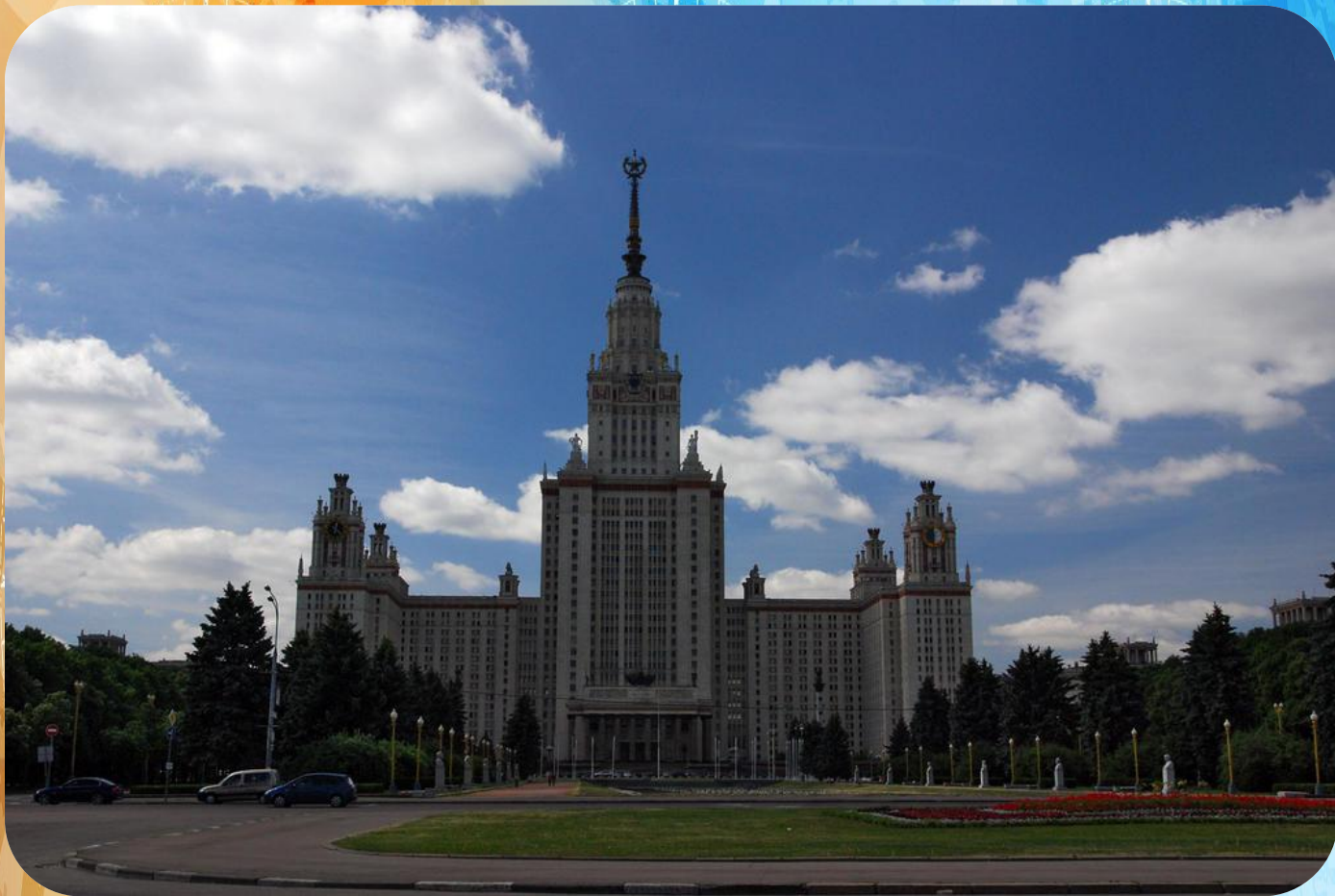
МГУ им. М.В.Ломоносова

В 1755 году по инициативе М.В. Ломоносова основан Московский университет. Михаил Васильевич добился того, чтобы принимали туда не только детей дворян, а всех сословий