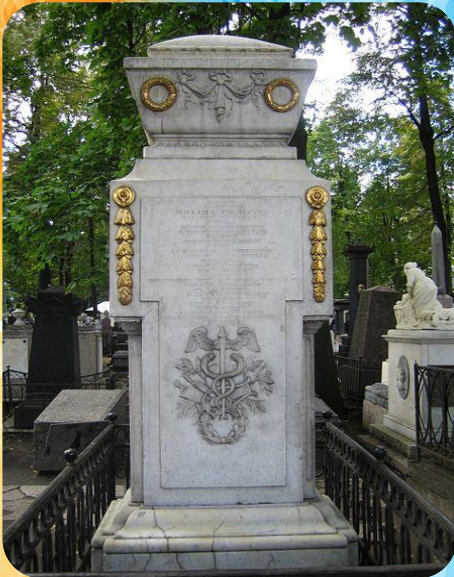
Могила М.В.Ломоносова в Александро – Невской лавре

Умер Михаил Васильевич 15 апреля 1765 года. Похоронен на Лазаревском кладбище Александро-Невской лавры в Петербурге.