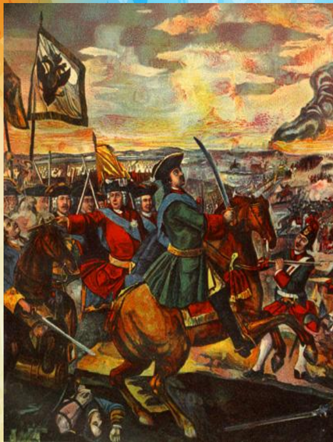
Мозаика «Полтавская битва»