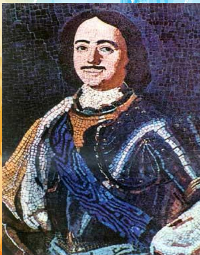
Мозаика «Петр I»