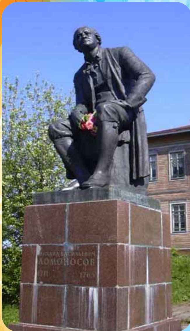
Памятник М.В.Ломоносову на родине

Путь М.В. Ломоносова в науку оказался тернистым, но очень интересным и ярким. Преодолеть этот путь Ломоносов смог благодаря своей целеустремленности и невероятной трудоспособности.