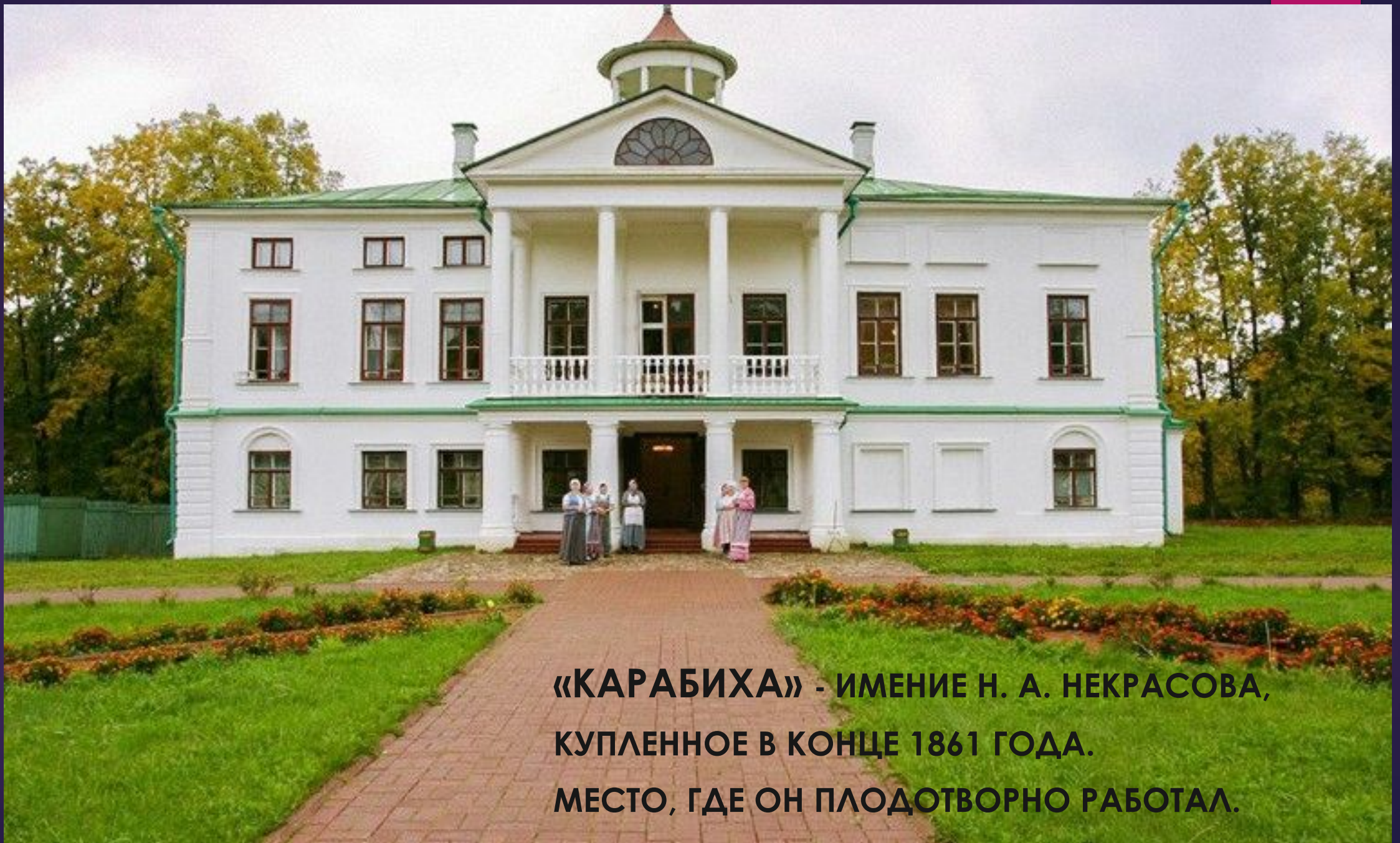
«КАРАБИХА» - ИМЕНИЕ Н. А. НЕКРАСОВА, КУПЛЕННОЕ В КОНЦЕ 1861 ГОДА. МЕСТО, ГДЕ ОН ПЛОДОТВОРНО РАБОТАЛ.